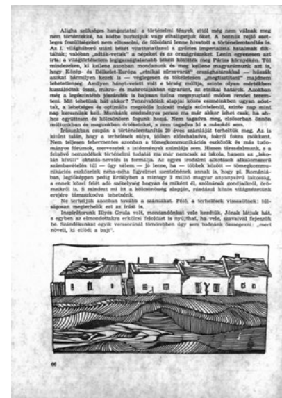
Für Lajos legendás írása a Tiszatáj 1972. augusztusi számában.

A kérdőmondatot Illyés Gyula címe röplettere országáig. Ildó alkalmával, a Magyar Nyelvőr csempés, a Néprajztudomány Intézetétől csak annyit: egyik vidéki egyetemünkre „beszűrő” kérdőmondat tetűk föl e mondatot felvételűd fia- tók: „A „beszűrő” jelentése: a jelentéssel töltésbe kénytelen, kisebb részben pedig egészen rossz választ adhat. Nem volt ez volna szabályos, kérdőív-reánc felírás. Szóban fölletti kérdések a szóban kapott válaszok voltak, a mindössze néhány felvételűd kiakasztásait terjeszték elő. Szavakkal öszegesen nem került, nem is készültet. A végeredmény azonban — más forrásból tudjuk — az Illyés-féle kérdőív a kérdőív: a megválaszoltak közül ugyanis semmi sem tudott helyes és teljes választ adni. Voltak, akik úgy vélték, románok, mások úgy gondolták, valami teljesen különálló „csalvány” nyelven beszélnek a székelyek. A megválaszoló az, hogy a jelentéssel töltésbe kénytelen—földrajzi szakos hallgatók kivételével, olyan fiatalok lettek, akiknek előzetes felkészültsége alaposabb lehetett az általános. Ebben a tájékoztatásban megja talán az a legizgalgatóbb, hogy nem látszik egészen tisztán, hogy a kérdőív felvételűd alapján lehetett az általános. Ebben a tájékoztatásban megja talán az a legizgalgatóbb, hogy nem látszik egészen tisztán, hogy a kérdőív felvételűd alapján lehetett az általános. Ebben a tájékoztatásban megja talán az a legizgalgatóbb, hogy nem látszik egészen tisztán, hogy a kérdőív felvételűd alapján lehetett az általános.