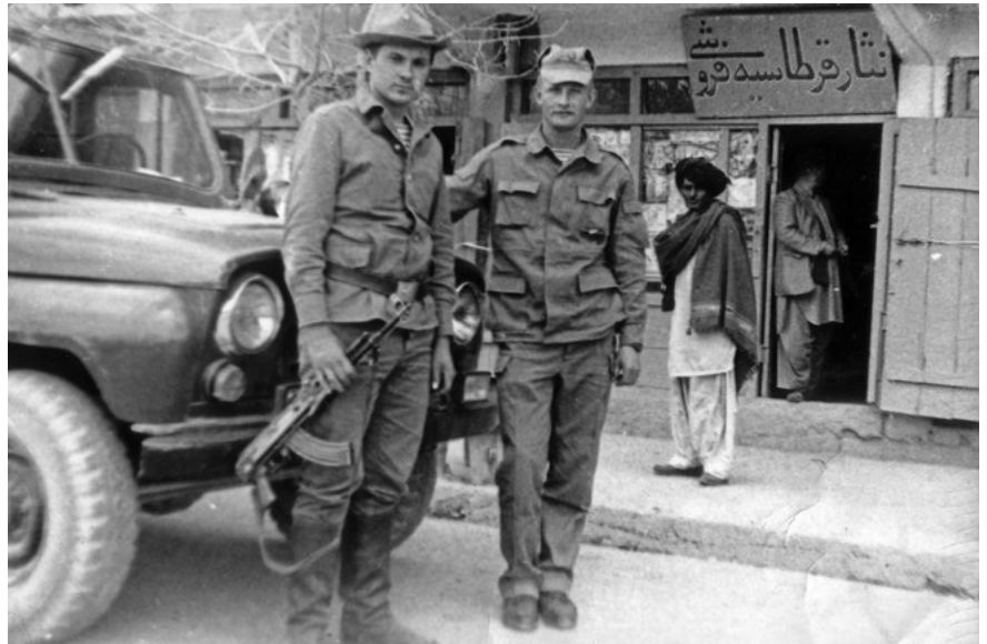
A szovjet hadsereg katonái az afganisztáni Gardezben, 1987-ben. A háborúban szovjet részről tíz év alatt mintegy 525.000-en vettek részt; közülük – újabb források szerint – 26.000-en lelték halálukat, 50.000-en pedig megsebesültek.

28-án az ún. Saur-forradalomban szovjetbarát afgán kommunista erők megdöntötték Mohammed Daoud Khan 4 uralmát, a Pakisztán által támogatott, kelet-afganisztáni bázisú mudzsahedinek 5 folyamatos harcot vívtak velük. A kialakuló helyzetben a revans esélyét meglátva, a lengyel származású briliáns gondolkodó, Zbigniew Brzezinski 6 azt javasolta Carter elnöknek, hogy indítsanak titkos programot a mudzsahedinek támogatására, ezzel szándékosan szovjet katonai beavatkozást provokálva ki. Jimmy Carter 1979. július 3-án jóváhagyta a CIA vezette Ciklonhadműveletet, amelyet az 1979 karácsonyán megindult szovjet fegyveres beavatkozás igazolt. 7 Az 1980. január 23-án meghirdetett Carter-doktrínában „radikális és agresszív új lépésként” aposztrofált afganisztáni háború – ellentétben az USA katasztrofális vietnami fiaskójával – Washington számára a tökéletes proxy wart jelentette. 8 A CIA egyik leghosszabb és legköltségesebb, ugyanakkor talán mindmáig legsikeresebb műveletében 1979 és 1989 között (tehát Carter, majd Ronald Reagan és George H. W. Bush elnöksége alatt) amerikai részről mintegy 3,9 milliárd dollárt költöttek a háborúra, s ugyanennyit adtak a szaúdiak is. Így a CIA – a pakisztáni titkosszolgálaton