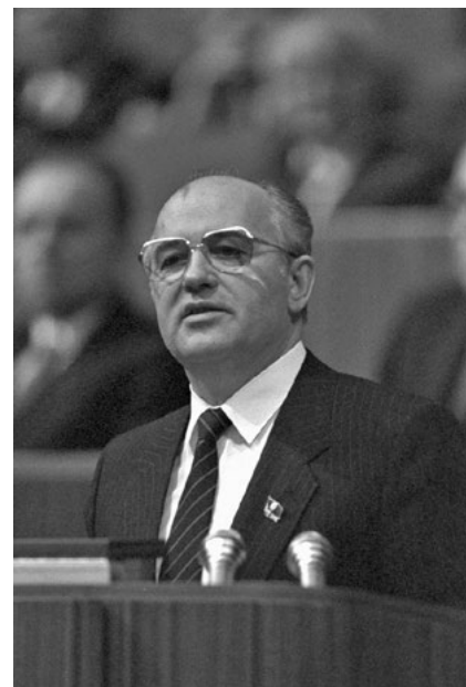
Mihail Gorbacsov felszólalása az SZKP KB 1986. márciusi XXVII. kongresszusán. A főtárgy Szovjetunió belső megerősítésére tett kísérletei egyre nyilvánvalóbb kudarcot jelentettek. Fotó: RIA Novosti archive / Yuryi Abramochkin, 770913-as számú kép.

Mihail Gorbacsovnak a Szovjetunió belső megerősítésére tett kísérletei (saját maga számára is) mind nyilvánvalóbb kudarcot jelentettek, éppen abban az időszakban,