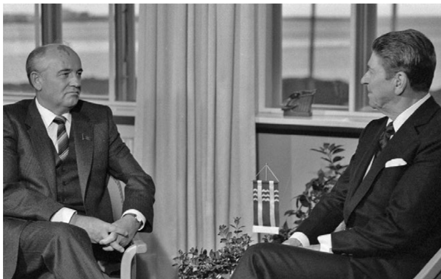
Mihail Gorbacsov és Ronald Reagan Reykjavíkban, 1986. október 11-én. Az SDI kapcsán patthelyzet alakult ki, melynek végén az amerikai elnök dühösen otthagyta tárgyalópartnerét és a szovjet küldöttséget. Fotó: RIA Novosti archive / Yuri Abramochkin, 46685-ös számú kép.

költségei, valamint az elnéptelenedő régió (a kieső területek) súlyosan megterhelték az amúgy is működőképessége végső határán járó sarló-kalapácsos gazdaságot. A kármentés mindemellett jelentős terheket rótt a Vörös Hadsereg egységeire is, s a Politbüro aggodó figyelmétől kísért akció hónapokkal odázta el a Gorbacsov által javasolt csúcstalálkozót. 19