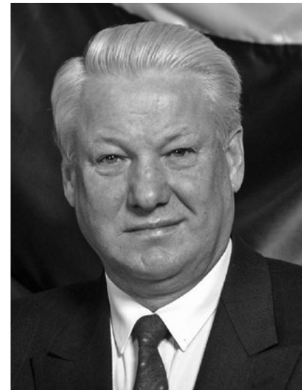
Borisz Jelcin, akinek fellépése nélkül talán egész Szovjet-Oroszország történelme másképpen alakul.

adaptálódott mindezekhez, s hamarosan sokak számára ismertté és egyértelművé vált eltökéltsége, határozottsága. Visszaemlékezések szerint a kockázatvállalástól sem riadt meg, s az 1970-es évek végére már számos alkalommal fogalmazott meg kritikát, például a tervutasításos gazdaságirányítás merevségével és hiányosságaival kapcsolatban. Az 1980-as évek elejére egyértelművé vált, hogy a fennálló szabályrendszerben Jelcin konformizmusa csak addig tart, ameddig azt saját érdekei diktálják. Újdonságot jelentett az is, hogy – ebben is évekkel megelőzve Gorbacsovot – hajlandó és képes volt nagy tömegek előtt, előre megírt szöveg nélkül, spontán beszélni, a tömegeből hozzá érkező kérdésekre válaszolni, akár úgy, hogy mindezt a körzetében élőben közvetítette a televízió.