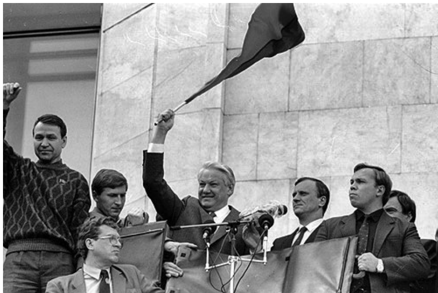
Borisz Jelcin 1991. augusztus 22-én, a moszkvai puccs bukása után, az Oroszországi Szovjet Szövetségi Szocialista Köztársaság Szovjetek Háza közelében.

Amikor Jelcin környezetéből Viktor Ivanenko, az oroszországi KGB feje felhívta saját szervezeti elöljáróját, Krjucskovot, jelezve, hogy a moszkvai emberek tömegén át az orosz törvényhozás épületéhez, a Fehér Házhhoz küldött tankokkal túl sokat kockáztat, a KGB feje így felelt: „a történelem lesz a bíránk”, s azzal letette a kagylót. Van valami döbbenetes abban, hogy a világ legsikeresebb titkoszolgálata fejének fókuszát továbbra is mennyire Gorbacsov jelentette (ironikusan meg is jegyezte, hogy miatta biztosan nem lesznek tömegek az utcán), s hogy e krízishelyzetben mennyire elveszítette valóságérzékelését. A puccsisták egy letűnt korszak eszközrendszerét erőltették egy olyan új világban, ahol azok már nem működtek. Nehéz, ha nem éppen lehetetlen megmondani, pontosan melyik volt az az év, melyben az összeadódó komplex folyamatok eredményeként maga a fennálló rend belső