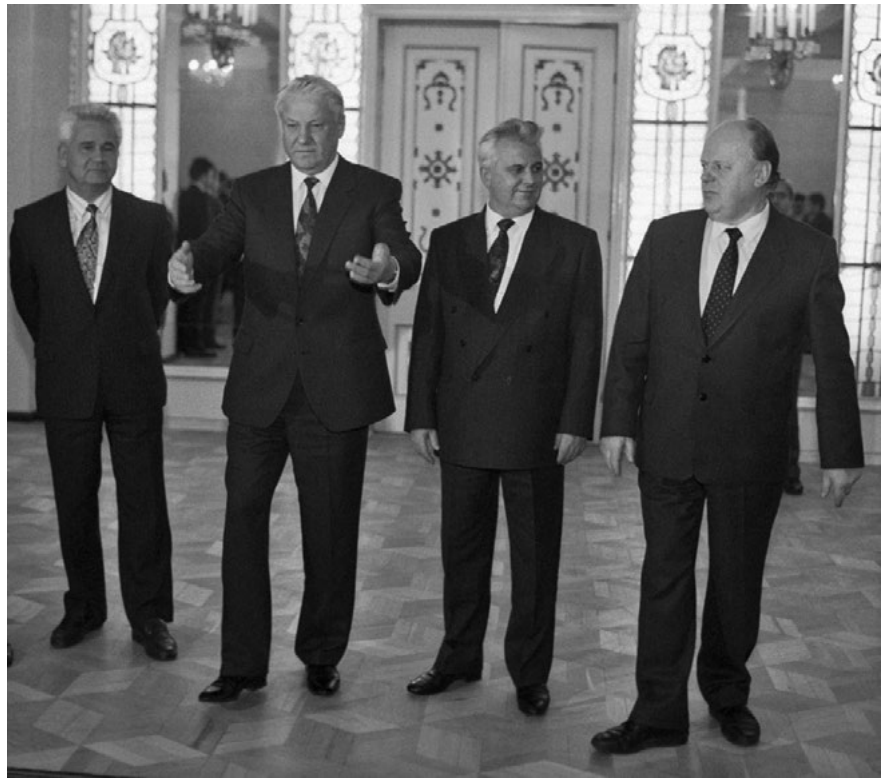
Borisz Jelcin Oroszország, Leonyid Kravcsuk Ukrajna elnöke és Sztanyiszlav Suskevics, a Belarusz Köztársaság Legfelsőbb Tanácsának elnökének találkozója Belavezszkaja Pucscsában, 1991. december 8-án. Az itt kötött megállapodás megszüntette a Szovjetuniót, és létrehozta a Független Államok Közösségét.

Mindezekkel egyidőben, miután Valentyin Varennikov tábornok 42 (az afganisztáni háború egyik tervezője és kivitelezője) hiába sürgette Kijevből összeesküvő társait, hogy lépjenek gyorsan és határozottan, végül maga is Moszkvába repült, s így augusztus 19-éről 20-ra virradóra eldőlt, hogy az orosz parlament épületét megostromolják, és fegyverrel veszik be. Bár a reggeli eligazításon Lebegy megpróbálta egyértelművé tenni, hogy mivel a környéken nagyjából százezres tömeg tartózkodik, a Fehér Házat pedig a fegyverrel is rendelkező védők barikáddal vették körül, az ostrom során hatalmas vérfürdővel kell számolni, Varennikov közbevágva rendre utasította. Pedig leginkább neki kellett volna tudnia, hogy egyrészt a helyszínen lévő parancsnokok információit nem lehet figyelmen kívül hagyni; másrészt, hogy a hároméves sorkatonai szolgálat, valamint az évtizedig húzódott afganisztáni háború miatt Moszkva tele van kiképzett, potenciálisan harcedzett fiatalokkal. E szomorú végjáték végkifejletét azután a Saposnyikov–Gracsov–Lebegy hármas Dimitrij Jazov parancsaival való immár nyílt és egyértelmű szembeszegülése pecsételte meg. A „nyolcak bandája” akkor fogyott ki az eszközökből, amikor a KGB részéről felvonuló Alpha Group egységeinek parancsnokai is sorra jelezték, hogy nem fognak Krjucskovék ostromparancsának engedelmesskedni. 1991. augusztus 21-én reggel Jazov marsall felhívta Krjucskovot, jelezve, hogy kiszáll, s reggel hatkor a