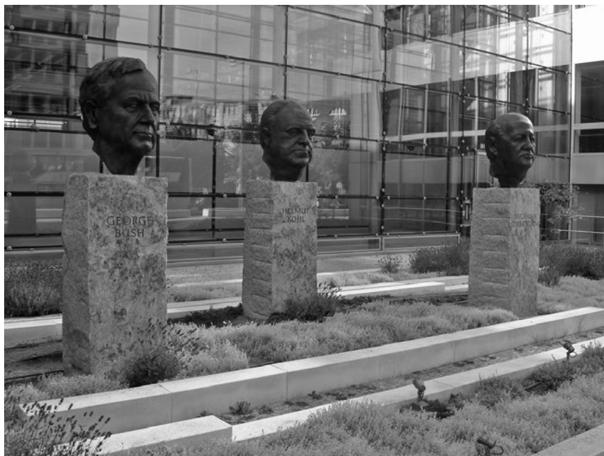
George Bush, Helmut Kohl és Mihail Gorbacsov szobra a berlini Axel-Springer-Neubau előtt. 1989 végén ők határozták meg leginkább Európa és egyben Németország sorsát.

gondolata. A hidegháború lezárásának igényével hivatalba lépő Bush-adminisztráció számára azonban ennek semmi valós relevanciája nem volt, mivel nem kívánták az arms race -ben immár alulmaradt szovjet vezetést egyenrangú partnerként kezelni. Kérdéses, hogy Mihail Gorbacsov és tanácsadói Málta előtt tudatában voltak-e ennek, pedig jövőjüket alapvetően ezen amerikai alapállás határozta meg. A csúcstalálkozó 1989. júliusi amerikai felvetése után az USA külpolitikáját még inkább dinamizálta azt követően, hogy a magyar, lengyel és cseh eseményekre reagáló NDK-ban az 1989. októberi tömegtüntetésekbe belebukott Honeckert váltó Egon Krenz és kormánya a nyugatra történő utazás megkönnyítésével akart időhöz és levegőhöz jutni. Amikor 1989. november 9-én egy olasz újságíró kérdésére válaszolva Günter Schabowski, a Német Szocialista Egységpárt (SED) kelet-berlini első titkára tévesen azt mondta, hogy az