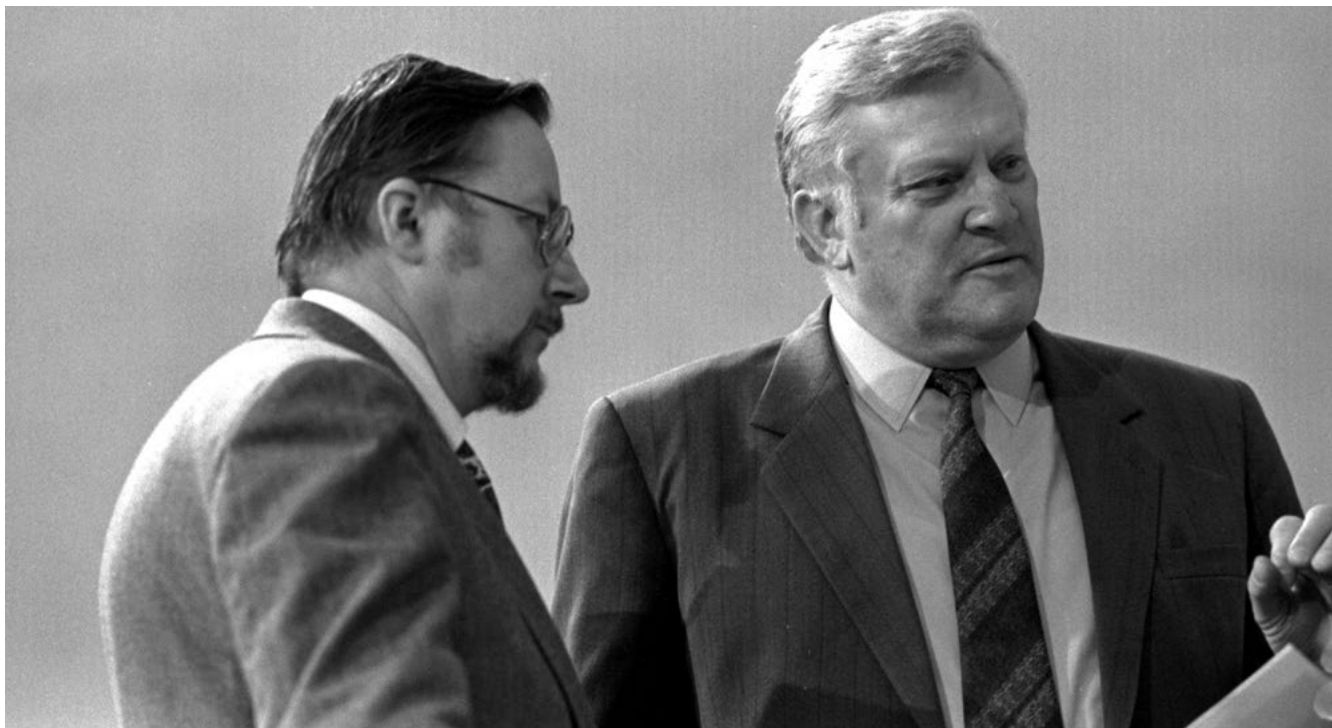
Vytautas Landsbergis, a legendás litván Sajüdis egyik alapító-vezetője és Algirdas Brazauskas, a Litván Kommunista Párt utolsó vezetője, az ország miniszterelnök-helyettese 1990 márciusában, Vilniusban.

Moszkva, pontosabban a gorbacsovi kurzus ekkor már nem volt abban a helyzetben, hogy érdemben befolyásolja az események sodrát. A keleti blokk felbomlásával, Kelet-Európa elvesztésével a Szovjetunió elveszítette azon birodalmi státuszát, mely Sztálin óta a Kreml önmeghatározásának szerves részévé vált. Könnyen belátható, hogy ez mélyen sértette a szovjet katonai vezetés prominenseit éppúgy, mint a „Nagy Honvédő Háború” milliónyi veteránjának lelkét. A 19. századi napóleoni háborúk után rögzült orosz igény a nyugati ütközőállamok és befolyási övezet fenntartására 1991-ben semmivé foszlott, s ez csak tovább rontotta Mihail Gorbacsov amúgyis mind negatívabb megítélését. Természetesen a sorkatonák szülei örültek annak, hogy fiaikat immár nem viszik hosszú időre akár több ezer kilométeres távolságba, ám a nyugatról hazatérő katonák azzal szembesültek, hogy