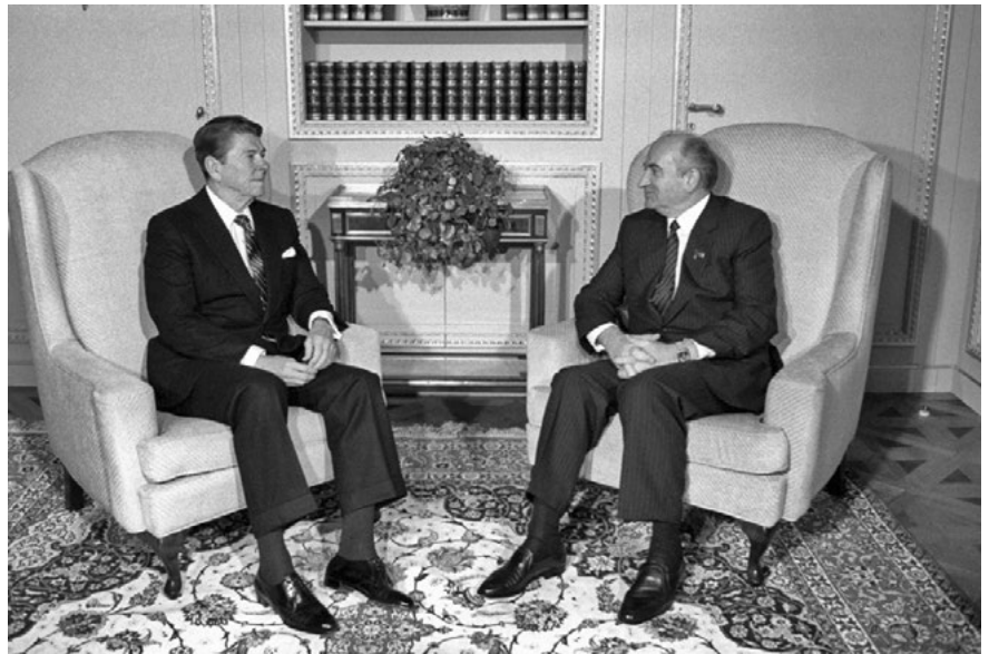
Ronald Reagan és Mihail Gorbacsov első találkozója Genfben, 1985. november 19-én. A svájci találkozó alapvetően a személyes megismerkedést és a másik fél felmérését szolgálta.

Tudjuk, hogy saját politikai célkitűzéseinek megfelelően az erőpolitika megvalósításával párhuzamosan Washington mindvégig szorgalmazta az érdemi amerikai–szovjet csúcstalálkozók újraindítását. Ennek jegyében George H. W. Bush alelnök már Csernyenko temetésére magával vitte Ronald Reagan levelét, melyben az elnök megerősítette tárgyalási szándékát. Újdonsült főtitkárként Gorbacsov alig két héten belül válaszolt, ám 1985. március 24-i levelében a genfi fegyverkorlátozási tárgyalássorozat folytatását nevezte a legfontosabbnak, a csúcstalálkozó kérdésére külön nem tért ki. 1985 májusában, Helsinkiben George Shultz külügyminiszter vetette fel ismét a kérdést Andrej Gromikónak: az