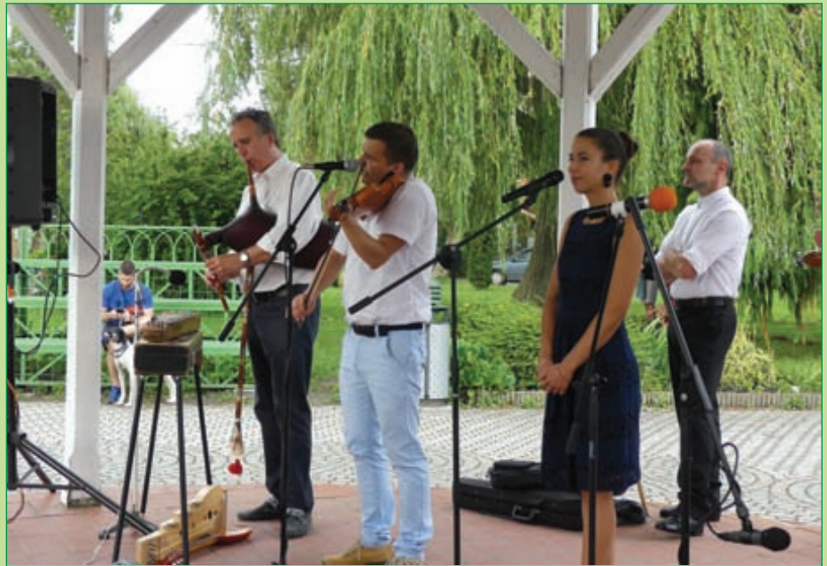
Kaposvár a színpadon