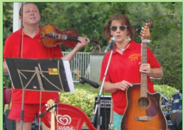
Játszik a Pizzicato