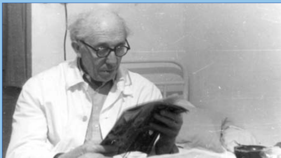
Továbbképzésen Marcaliban (1960)