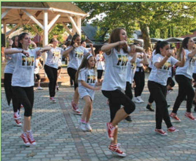
Starlight Dance Company