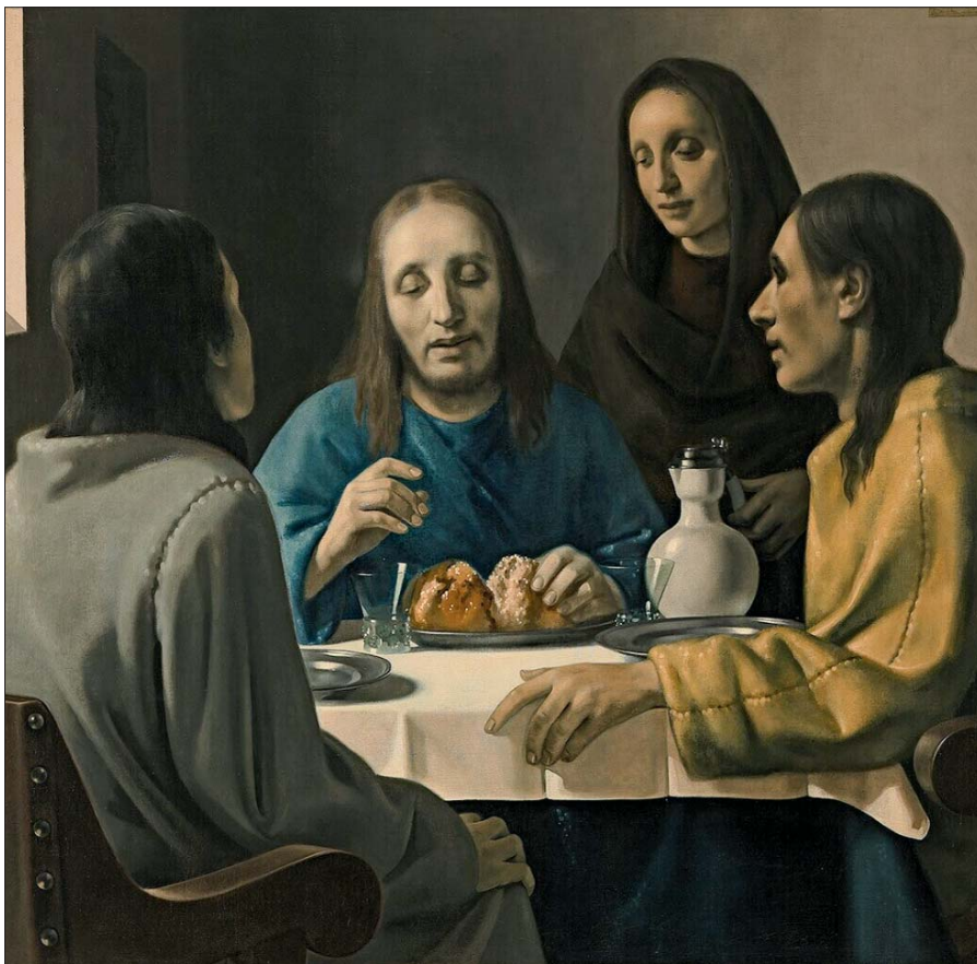
AZ EMMAUSZI VACSORA – HAN VAN MEEGEREN BÖRTÖNBEN FESTETT FESTMÉNYE

Ha nem szerepel a műtárgyhamisítás a Btk-ban mint önálló tényállás, akkor melyik büntetendő tényállás alapján lehet vele szemben fellépni? A kérdésre korábban is, most is a választ a csalás tényállása adja meg, jobb híján. A Btk 373. § (1) szerint „Aki jogtalan haszonszerzés végett másrt tévedésbe ejt, vagy tévedésben tart, és ezzel kárt okoz, csalást követ el.” Az első pillanatban is látható, hogy ez a tényállás elsősorban nem a hamisítóra, hanem tipikusan a képet eladó műkereskedőre illik legjobban. És azonnal szembeötlő, hogy a hamis műtárgyat eladó galériások pontosan ennél a több tényállási elemet is tartalmazó tényállásnál azonnal megtalálják azt a rést, ahol el tudnak menekülni. Ez pedig a „tévedésbe ejt vagy tévedésben tart” tényállási elem. Az eladók szinte minden esetben arra hivatkoznak, hogy nem volt tudomásuk a műtárgy hamis voltáról, így ők senkit nem tévesztettek meg tudatosan, mert maguk sem tudtak arról, hogy a műtárgy hamis.