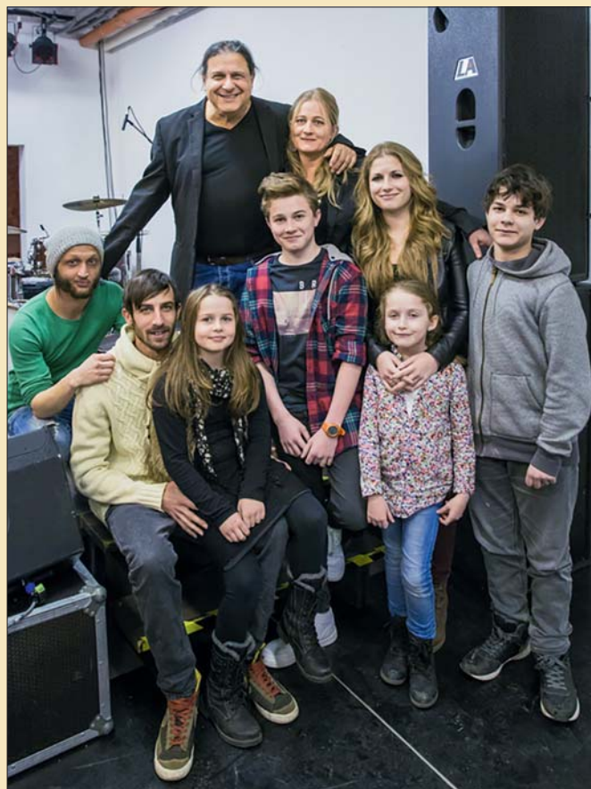
SZÚK CSALÁDI KÖRBE