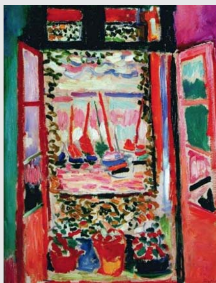
MATISSE? RENOIR? HORY?

kat, de az „ibizai mestert” fillérékért dolgoztatták. Elemér fellázadt, hát többet adtak neki, de soha nem kapta meg a neki járó harmadrészt. Műtermében olykor tíz festőállvány állt, mindegyiken másik művész képe készült. Mint a sakkbajnok, aki sok ellenfelével szimultán játszik, úgy festette műveit. Ám Legros és Lassard, a két cinkos Párizsban sok más csalást is elkövetett, lebuktak, és beárulták egymást. Ráadásul az 1960-as és '70-es évekre a tudomány is fejlődött, új műszereket és módszereket fedeztek fel,