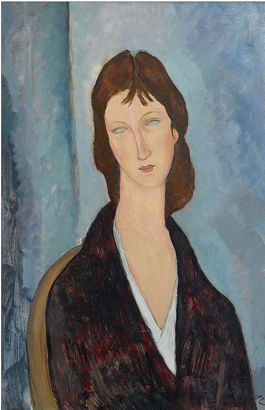
ELMYR DE HORY – HOMMAGE À MODIGLIANI

Rengeteget tanult, és mielőtt egy adott képzőművész modorában készített volna egy képet, mindent tudott már az illető szokásairól, életének és művészetének összes szakaszáról, így a születő kép beleillett az utánzott mű-