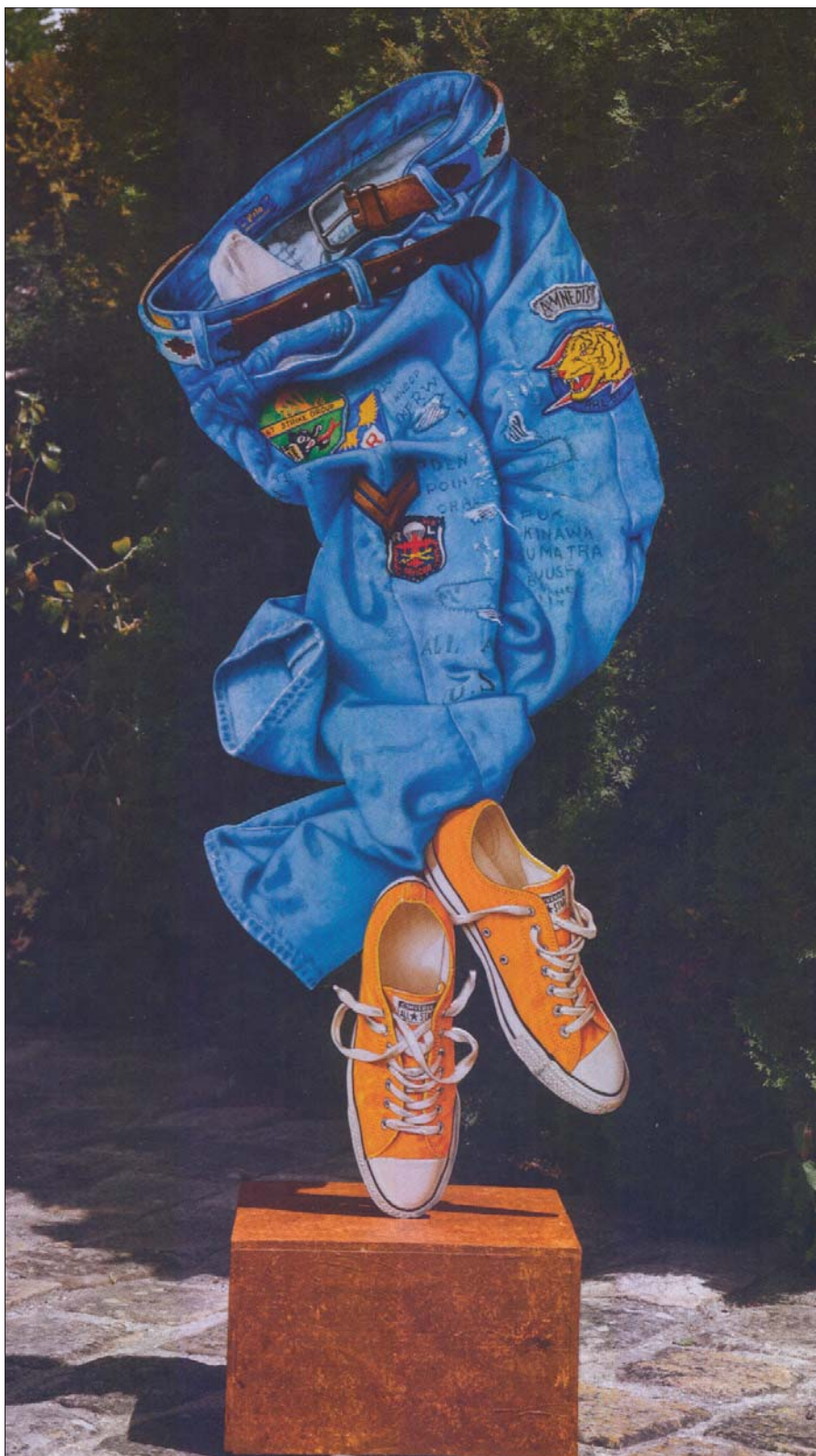
POP EMLÉKMŰ N° 2

játékuk, mert megőrizték. Én a köveket, a színes hordókat is szépnek látom. Matematikus volt az édesapám, világgraszoló eredményei voltak a térgeometriában. Ő volt az Eötvös Loránd Egyetemen a matematikai tanszék vezetője. A körök elméletével