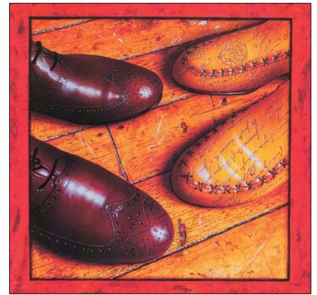
A CIPŐK BESZÉLGETNEK ÉJSZAKA

„Örkényt szeretem, Hemingwayt szeretem. Krúdy Szindbádját szeretem. Egy rövidke novella is lehet ugyanolyan izgalmas, mint egy nagyregény. Az igazság a lényeg. Es felismerni, hogy a világban nemcsak egyfajta igazság létezik.”