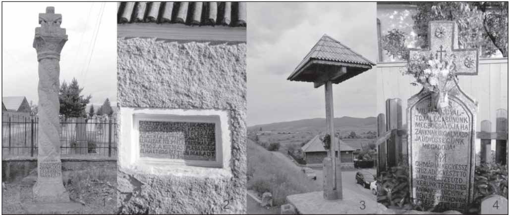
2. ábra: Járványokra emlékeztető tereptárgyak a csíkszéki és a kászoni falvak térszerkezetében Jelmagyarázat: 1. Csíkszentimre; 2. Csíkkozmás; 3. Csíkszentkirály; 4. Csíkszentmárton