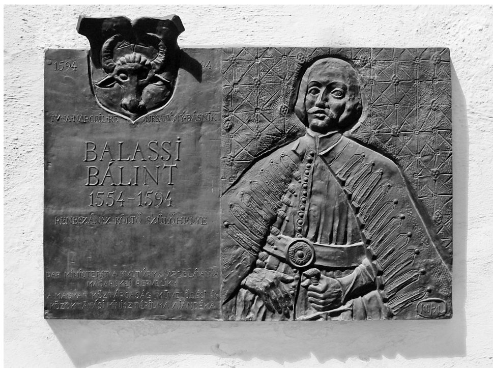
Kő Pál: Balassi Bálint, Zólyom, 1994