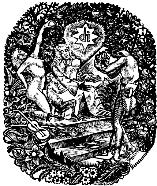
Nagy Árpád fametszete, X2 (1956), Op. 424 (300), 80×65