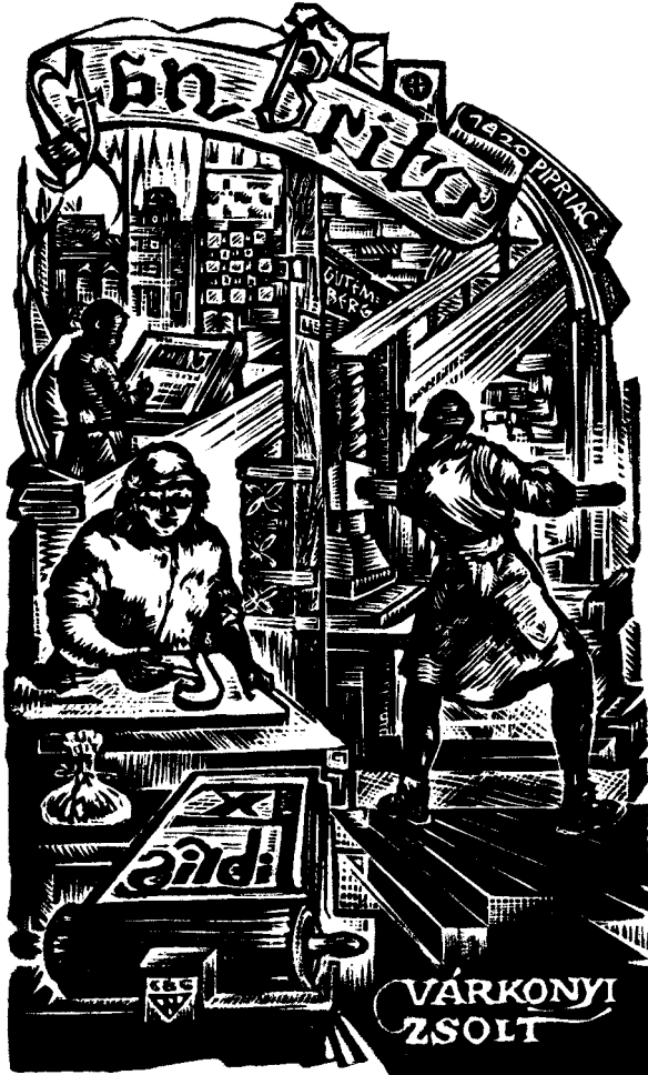
Nagy László Lázár fametszete, X2, 130×75

A vaskos szám Jan Brito, a „breton Gutenberg” emlékének szentelt exlibris pályázatról számol be. A Pipriac-ból, egy kis breton városkából származó nyomdász életét és szülővárosát cikkek mutatják be. A versenyen első helyezéseket elért hét legjobb alkotásnak és szerzőiknek egy-egy teljes oldalt szentelnek. Utána hosszú oldalakon közlik az említésre érdemes exlibriseket a pályázat anyagából, köztük a nyírbátori