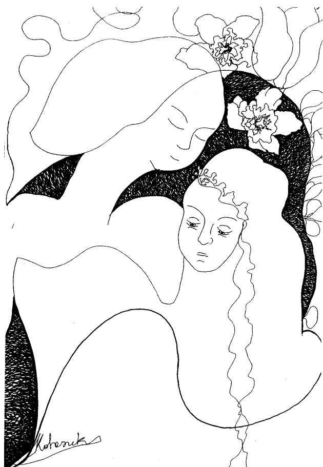
Kotaszek Helga: Koszorú, P1, 145×100

Mitteilungen der Deutschen Exlibris-Gesellschaft 2011/2. A német egyesület aktív gyűjtői és társasági életéből nyújt íze- lített több cikk is: beszámolva a 2011-ben Herdecke-ben tar- tott társasági napról. Illusztrációként a találkozó résztvevőiről és a meghirdetett ex libris pályázat kisgrafikáiból láthatunk válogatást.