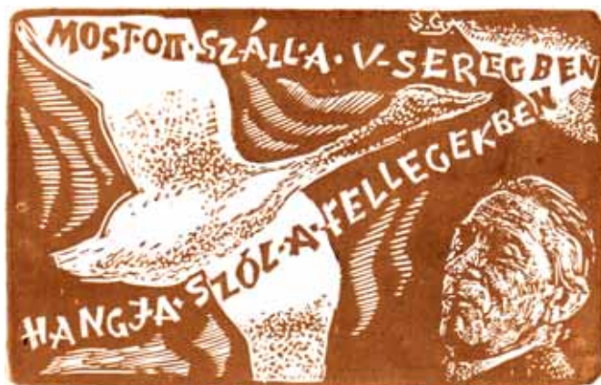
Sajtós Gyula linómetszete, X3 (2002), 80×125 (Áprily Lajos: Vadlúd voltam c. verse)

Budapesten, a Képzőművészeti Főiskolán grafika szakra iratkozott be. Alapozó képzést Kmetty János és Raszler Károly osztályában kapott. Kmettytől hallott mondás egy életen