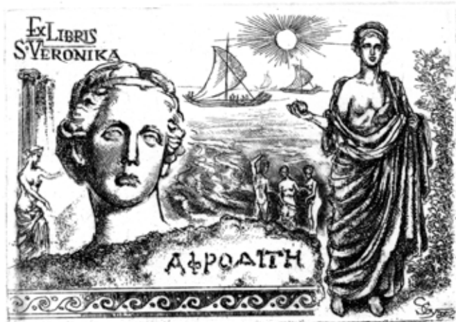
Sajtós Gyula rézkarca, C3 (2002.X.21.), 70×97

Első a művészi ébredés szakasza, ehhez tartoznak a közép- és felsőfokú tanulmányok. Két város, Székesfehérvár és Budapest kiváló iskolái és mesterei pallérozták tudását, amelyekre ma is szeretettel és hálával emlékezik. Ahogy egész életére érvényes útravalót kapott tőlük, későbbi alkotói szak-