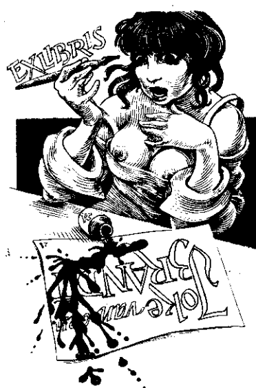
Frank Ivo van Damme rézmetszete, C2, Op. 28 (1988), 114×74

Az alkotásait összefoglaló katalógus 206 oldalas és 21×29 cm méretű. Ára 35 euro, melyhez még a postaköltség járul.