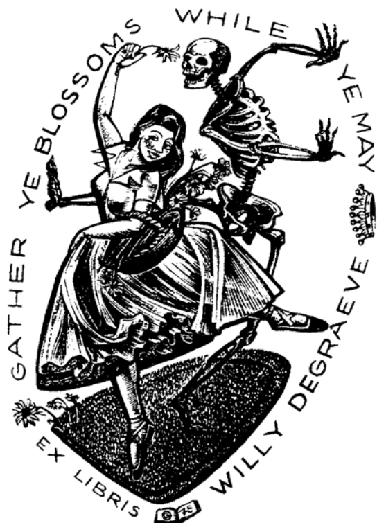
Gerard Gaudaen fametszete, XI (1975), 96×67

A svájci SELCEXPRESS 80. számában több írás szól arról a nagyszabású kiállításról, melyet 2010 márciusától láthatott a közönség Sachseln városban. A tárlat címe: Memento Mori volt és ezen Josef Burch gyűjteményéből mintegy 190 ilyen tárgyú