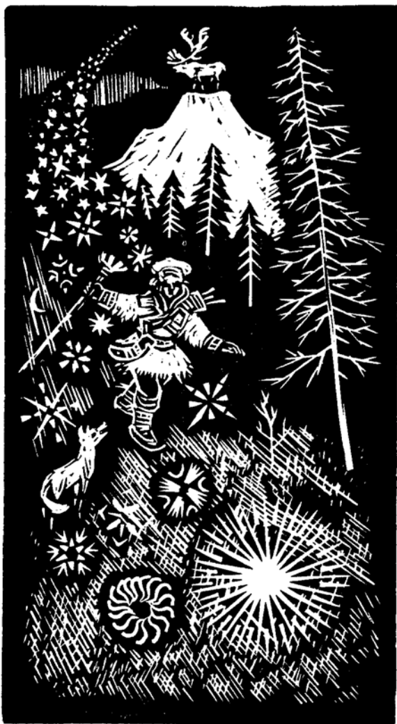
Jurida Károly linómetszete, X3, 135×75 „Kanteletár” finn versek illusztrációja