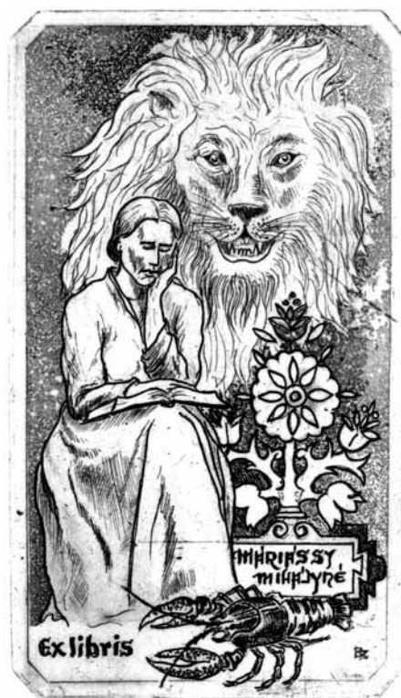
Bagarus Zoltán rézkarca, C3