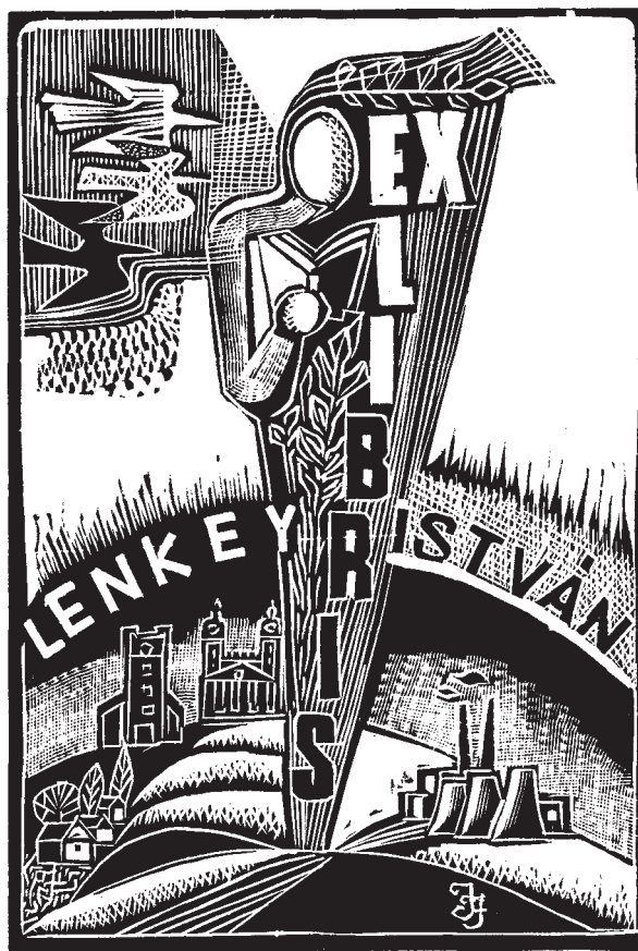
Józsa János fametszete, X2 (1973)

Vannak életünkben a sors furcsa szeszélyétől, a vak véletlentől függően különös, megmagyarázhatatlan találkozások, de azért leírható, elmondható, hogy végül is hogyan történtek. Ilyen volt az én találkozásom az ex librisrel.