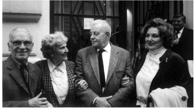
Szeged, 1999. április 23.