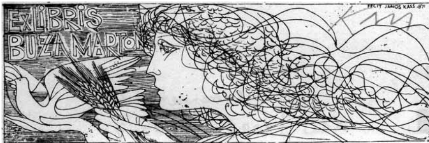
Kass János rézmetszete, C2 (1987)

Szinte hihetetlennek tűnik, de nagy örömünkre élő valóság: a 80 esztendő Kass Jánossal együtt ünnepelhetjük ezt a szép alkalmat, aki a jelenkori magyar, tehát az európai ipar- és kép-