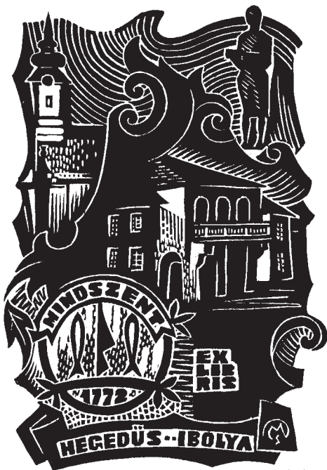
Csiby Mihály linómetszete, X3 (1982)