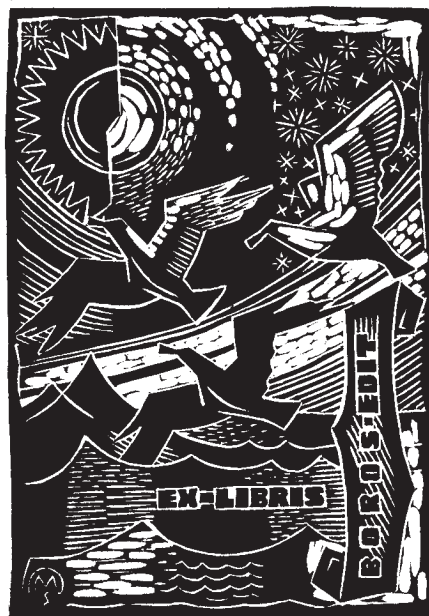
Csiby Mihály linómetszete, X3

Könyvjegyeit azonnal felismerhetjük és megkülönböztethetjük az egyedi megformálásuk, valamint a sajátosan kiala-