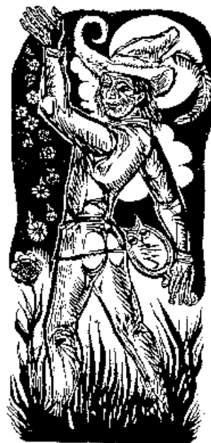
Antoon Vermeylen rajza,