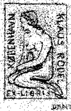
Eredeti méret: 8X5 mm

Feltűnést keltett szőlős-boros témájú munkáival. Ez a téma akkoriban lett népszerű, főként Lippóczy Norbertnek a híres gyűjteménye és annak kiállítása folytán. Egyre több külföldi gyűjtő rendel nála ex librist. Témavilága egyre bővül, az alkalmi grafikák mellett szívesen ábrázol virágot, műemlék-épületeket, városképeket, vagy teszi át rézlemezre klasszikus mesterek (pl. Dürer) rajzait. Ex librisein megjelentek