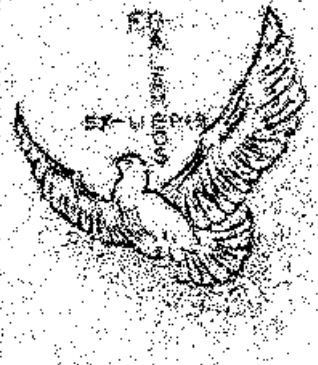
Eredeti méret: 9X8 mm