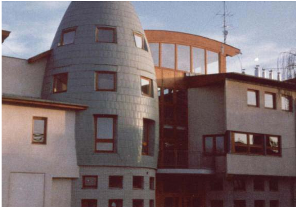
Nyírmeggyes ma: művelődési központ és könyvtár

A nagy lélekszám nyilvánvalóan a csekély vagyon elaprózódásával, illetve családon belüli rétegződéssel is együttjárt. A Szondiak közt voltak jobb módúak és szegények, jó erkölcsűek és kevésbé tisztességesek egyaránt. Kétség kívül kiemelkedtek társaik közül, akik a helyi közösség vezetőivé váltak. Az adott kornak megfelelő poszton, volt köztük városi főbíró és falusi bíró, illetve nemesek hadnagya és egyházközlöny egyaránt (ahogyan később, az általam már nem vizsgált 20. században, bíró és tanácselnök is). Aligha tévedünk, ha a másik oldalra soroljuk azokat a (minden bizonnyal többséget alkotó) családtagokat, akik néhány holdnyi parcellán, gazdálkodásból próbálták megélni, vagy másnak a szolgálatába, illetve napszámossá szegődtek, s nemességükről is lemondtak. Ily módon a családról alkotott kép egyáltalán nem egységes, viszont az egész község társadalmáról, életéről is árulkodik.