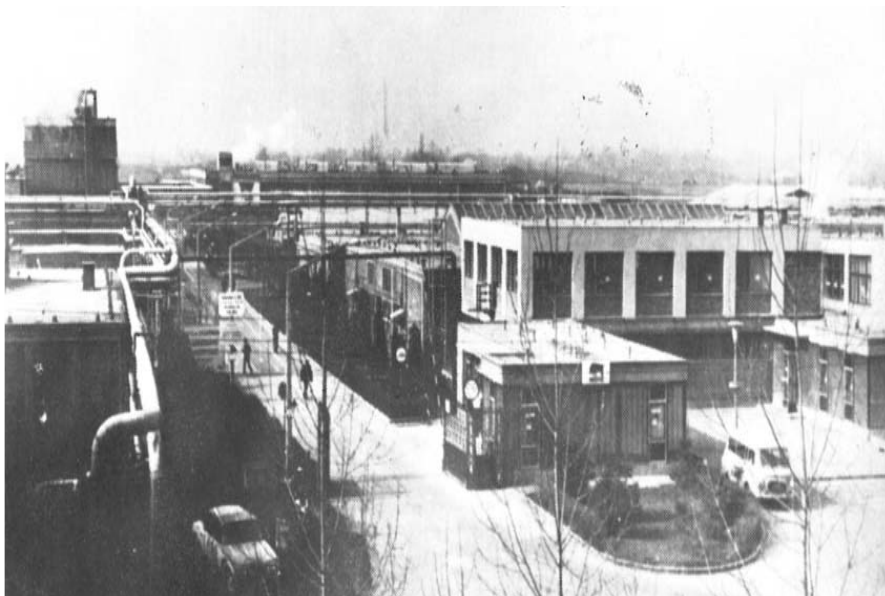
A nyiregházai gumigyár az 1970-es évek közepén