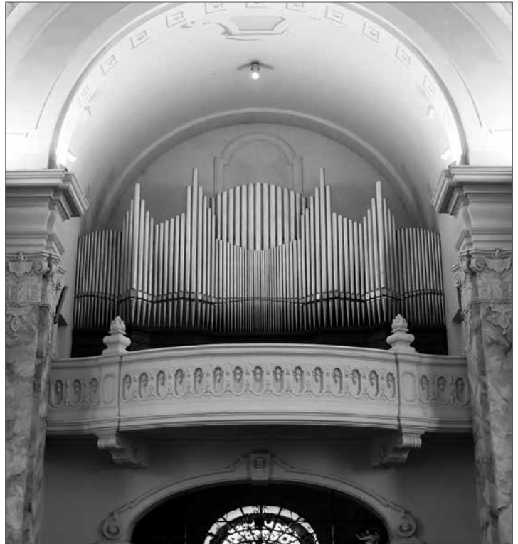
A ferences templom orgonájának homlokzati sípjai szabadon hullámozó alakzatúak.

1989. szeptember közepétől, harminc éve ismét a Szűz Máriáról nevezett Ferences Tartomány végzi a lelképásztori teendőket a plébánián. A 2000-es évek