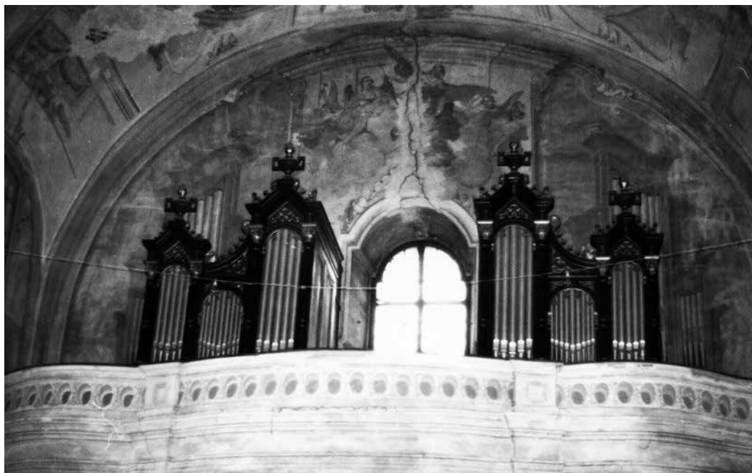
A zsinagóga volt Angster-orgonája a Mária Magdolna plébániatemplom karzatán állt 1961 és 1998 között a festett freskóval borított templomfal előtt.

pozíciója (hangszín-összeállítás) alapján. A cég 2107 sípot épített be a hangszerbe 1800 kg ón felhasználásával. A hatméteres, mély hangot adó legnagyobb sípok a homlokzatban állnak, a legkisebbek csak 5 mm hosszúságúak. Az új hangszer a pódium fölött, falba süllyesztett állványzaton áll, homlokzatával a hallgatóság fő szemléleti irányába. A szabadon maradt pódium ezáltal helyet hagy a rendezvények-