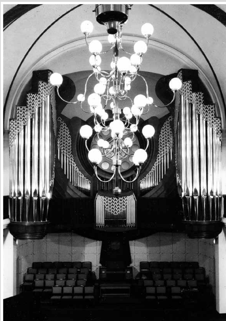
Az Aquincum Orgonaüzem által épített hangversenytermi orgona körbefonja az ablakot.

később rendelték meg, mégpedig az esperesük tanácsára a neves pécsi Angster József és Fia orgonagyártól. A cég három ajánlatot is adott, és a lutheránus gyülekezet – szintén az esperes javaslatára – a hatváltozatú költségvetést fogadta el 2490 koronáért, mondván, nem koncertorgonát szeretnének, csak egy liturgikus célú kisebb hangszert. A gyár által ajánlott mintákból az egyháztanács a templom stílusához illő neogótikus orgonaszekrényt választotta fiatornyokkal, a homlokzatban öt sípmező-