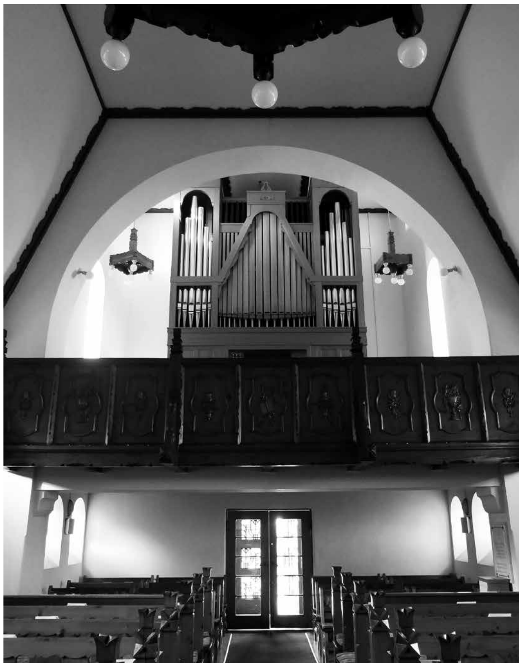
A református templom új orgonája 2013-ból.