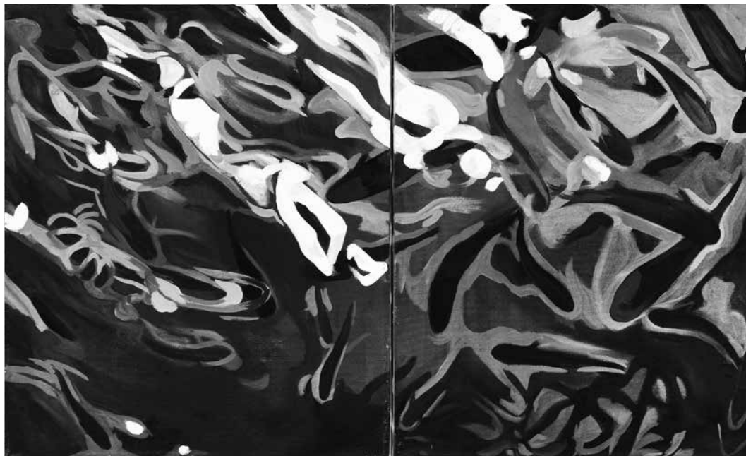
Tánczos György: Víz asszociáció

(Kukorelly Endre: Pálya, avagy Nyugi, dagi, nem csak a foci van a világon , Kalligram, 2018)