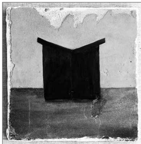
Tóth Norbert: Ikerbudi – szekko, 2018