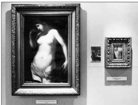
Részlet a kiállításról