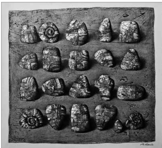
Akhsar Esenov (Oroszország) munkája