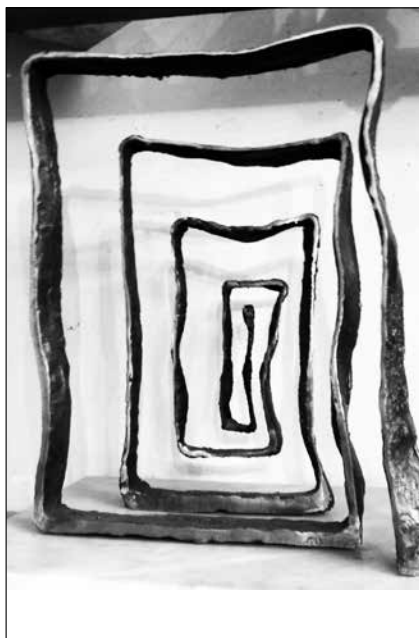
Balás Eszter: Az út

pápai megrendelések érlelték meg a gondolatot Lorenzo Pierfrancesco de Mediciben, hogy az Isteni színjáték által inspirált képsorozatot rendeljen Botticellitől a firenzei dóm számára. A festő 1481-91 között mintegy száz miniatúrát festett pergamenre a nagy mű előkészítéseként, ebből kilencvenkettő fenn is maradt, igazolva Vasari ítéletét, aki „csodálatos dolognak” nevezte azokat a műveket, amelyek a végül meg nem valósult nagyszabású munkát előkészítették.