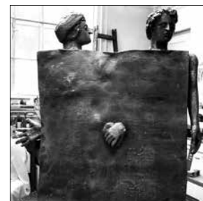
Balás Eszter: Dante és Vergilius