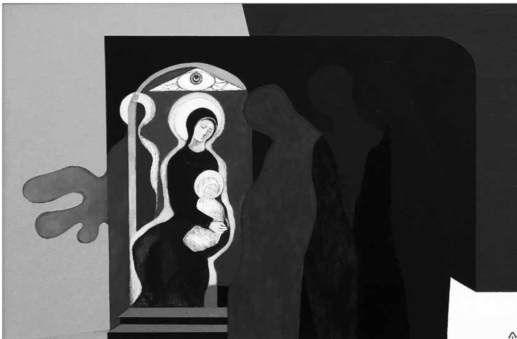
Aknay János: Háromkirályok (Mária bemutatja a kis Jézust) 2014