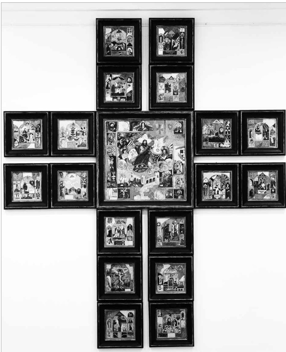
Tábori Csaba: Jézus élete 21 képen