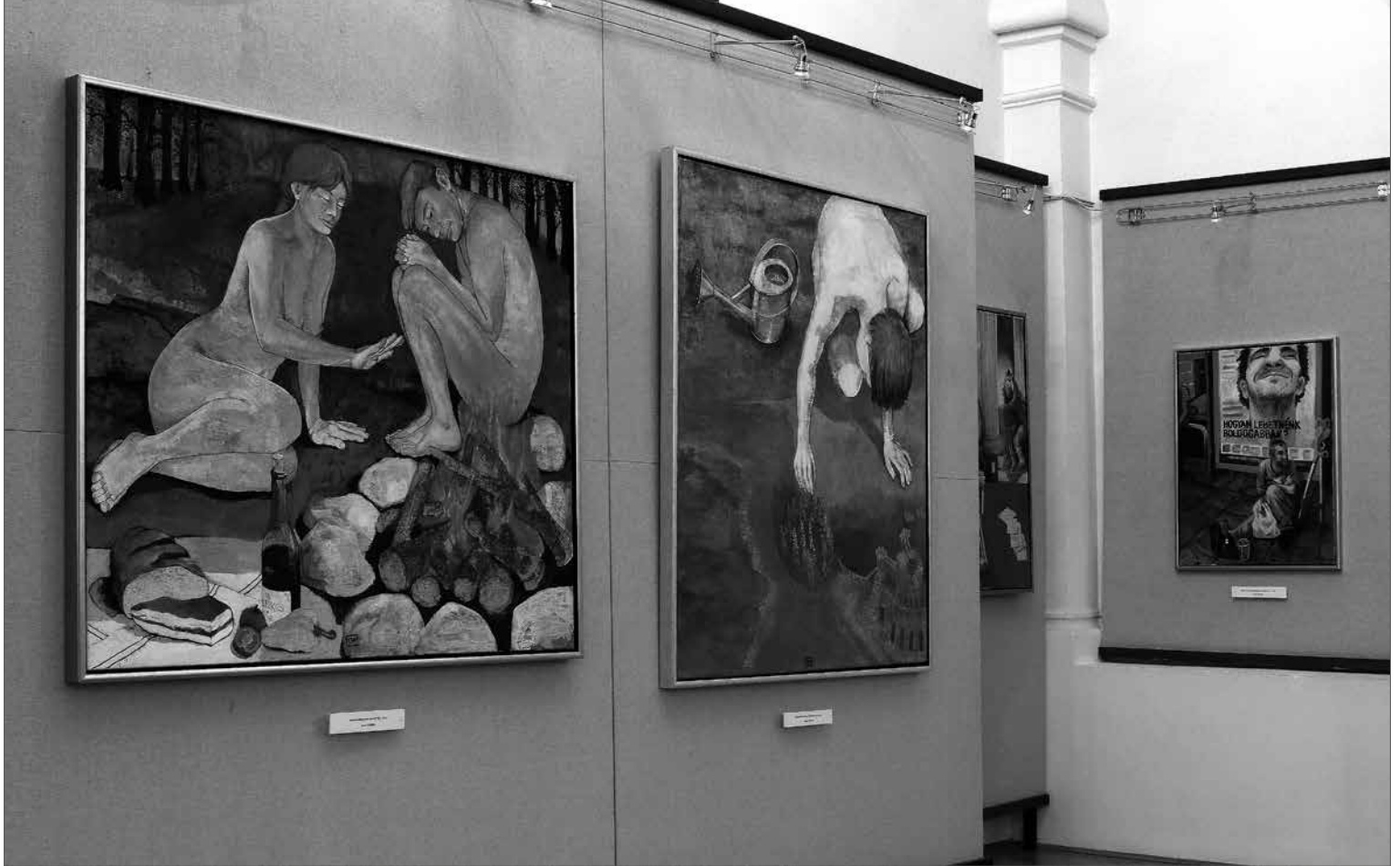
Enteriőr a kiállításról