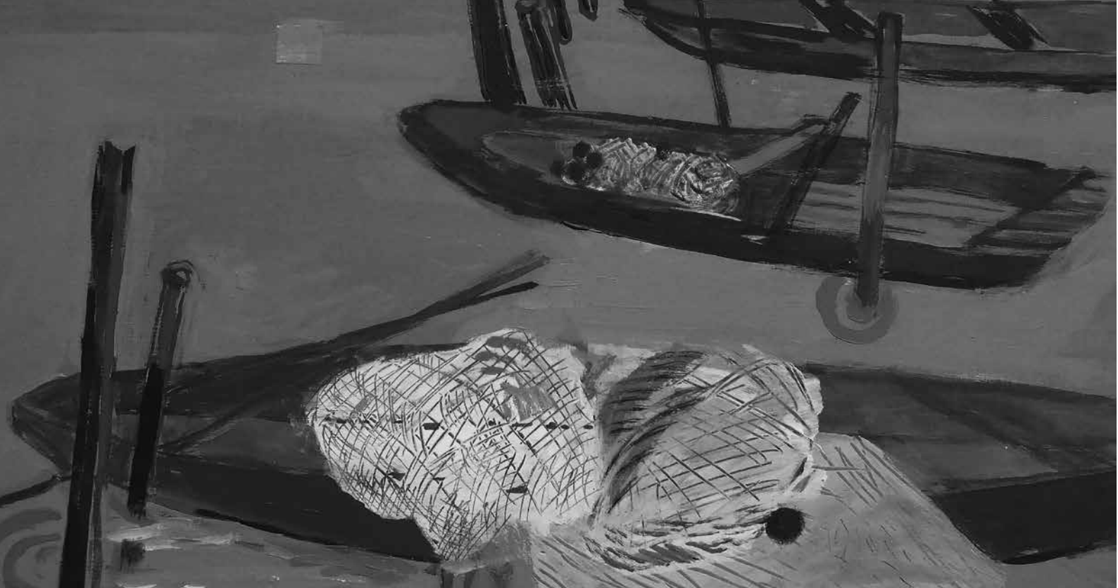
Stiller-Luzsiczka Ágnes: Csupaki csónakok - részlet