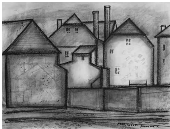
Luzsiczka Lajos: Tábor