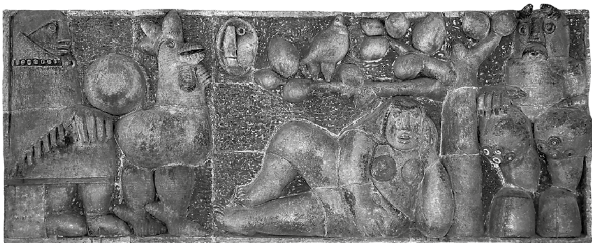
Németh János: Az ördögszántotta hegy legendája (részlet) –1970