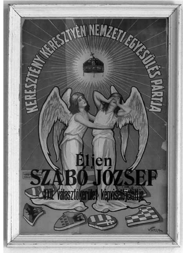
Korabeli választási plakát

A malom-galériába lépőt most is elkápráztatja a pazar tárgyi és képi kavalkád. A háború „megszelídített” és a hátszág kitaruló, olykor méreteiben is lehengerlő, változatos mozaikszemekből összerakódó, kissé mondén hangulatú tablója. Ám ez a tabló