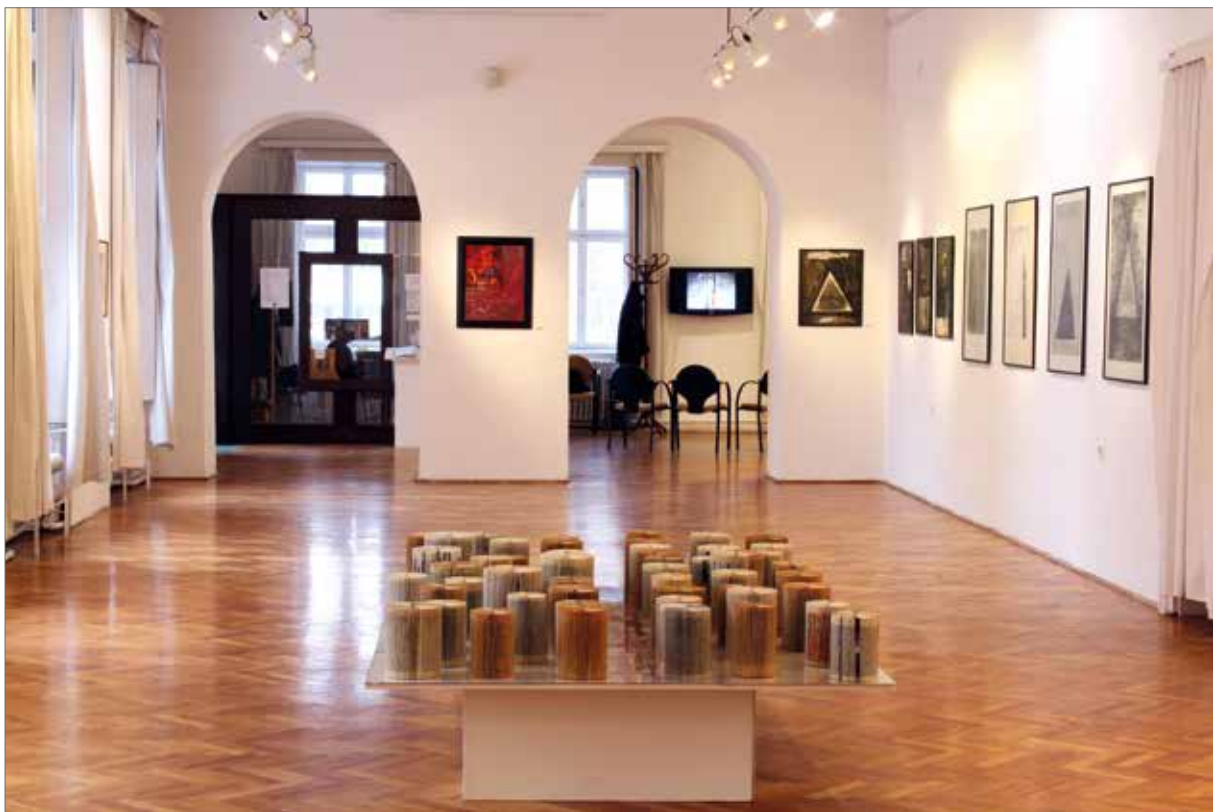
Kiállítási enteriőr a Göcsej múzeumban

Hegy Lóránd írt egyszer a kelet-európai avantgárd szelíd, (ön)ironikus lázadásáról, mely ugyanakkor következetes és makacs. Hasonlóan mondhatjuk, csendes, szelíd avantgárd, amivel a hatvan éves művész szembesít bennünket. A csábítások és csalódások sem térítették el választott szenvedélyétől. Budaházi lapjain a drasztikum átpoetizálódik finom, talányos jelmezővé, melyeken az apokalipszis lovasai, a bibliai szörnyek, vagy János jelenései szeriális kompozíciókká, emblematikus formaelemekké alakulnak. Ám a játékosnak tűnő dekorativitás mögött ott lüktet a tragédia, felsejlenek a sötét, fenyegető árnyak, ahogy érzékelhető az égi szférák arany „fedezete” is: a mindent látó szem ítéletében megnyugvó örök (gyermeki) bizalom. Ami kiapadhatatlan éltetője, forrása ennek nyughatatlan, spiritualitástól ihletett művészetnek.