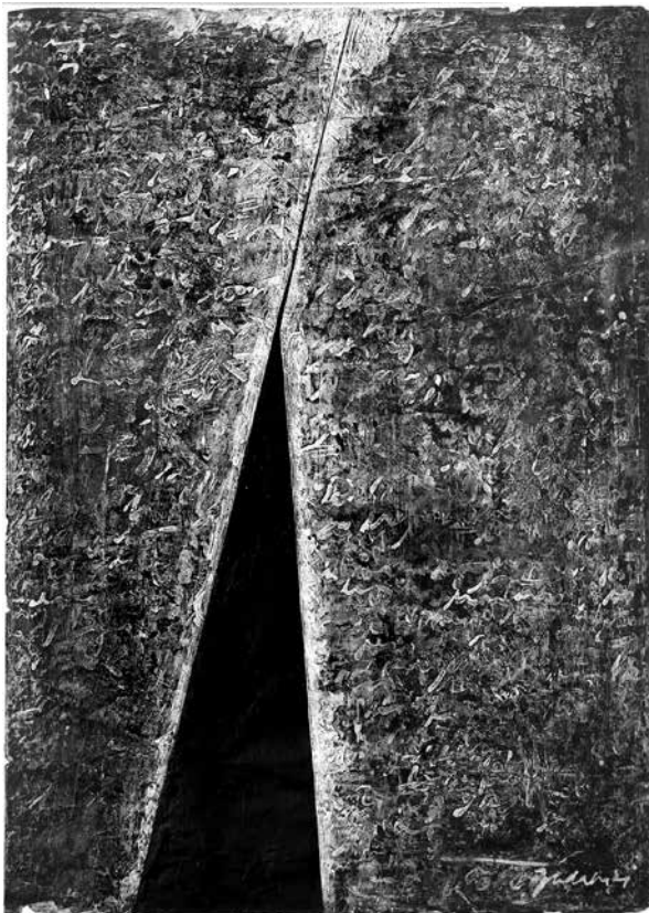
BUDAHÁZI TIBOR: Alak - 2011