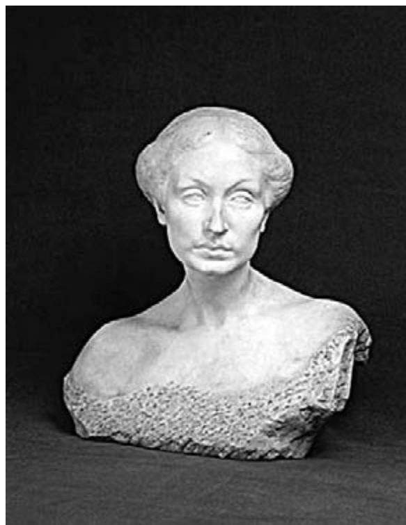
Zala György: Tanulmányfej

1896-ban a művész alkalmilag kirándult a szecesszió területére. Merész kísérletet tett: többféle színes márvány felhasználásával mintázta meg barátja, Szemere Attila feleségét, Morawetz Henrikát, felhagyva a klasszicizáló-akadémikus-naturalista stílus idáig tőle megszokott jegyeivel. Az arc nem