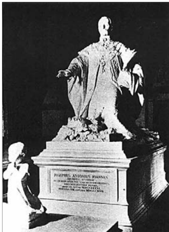
József nádor fehérmárvány szarkofágja Zala György szobrával

József nádor fogadalmi szobrát Zala 1887-ben mintázta meg az alsúti főhercegi kastély kápolnája számára. Látszik, hogy a család valóban