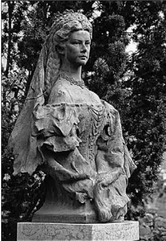
Zala György: Erzsébet királyné

ismerősöket és barátokat – gondoljunk pl. a Jármay és a Zsigmondy családra – csak egyvalakit nem, mégpedig saját magát!