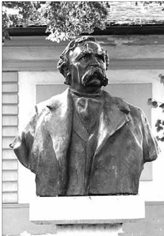
Zala György: Deák Ferenc portrészobra

A királyi palotába Andrássyé mellett Deák Ferenc portréja is bekerül – mindketten fontos szerepet