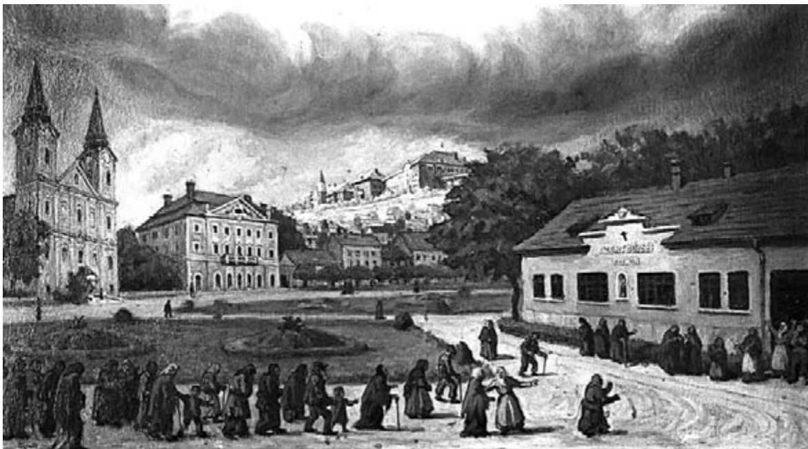
Korabeli festmény a szeretotthonról és a térről...

Hatalmas munkát fektetett az utolsó, a másodikvilágháborúmiattmár nem realizálódott építkezésbe, egy iparosok számára épülő tanoncotthon megvalósításába. Szükségessége mellett így érvelt: „Zalaegerszegen 300 kisiparos él, de a kisiparosi, részben kiskereskedői utánpótlás hiányzik. A visszakerült területek