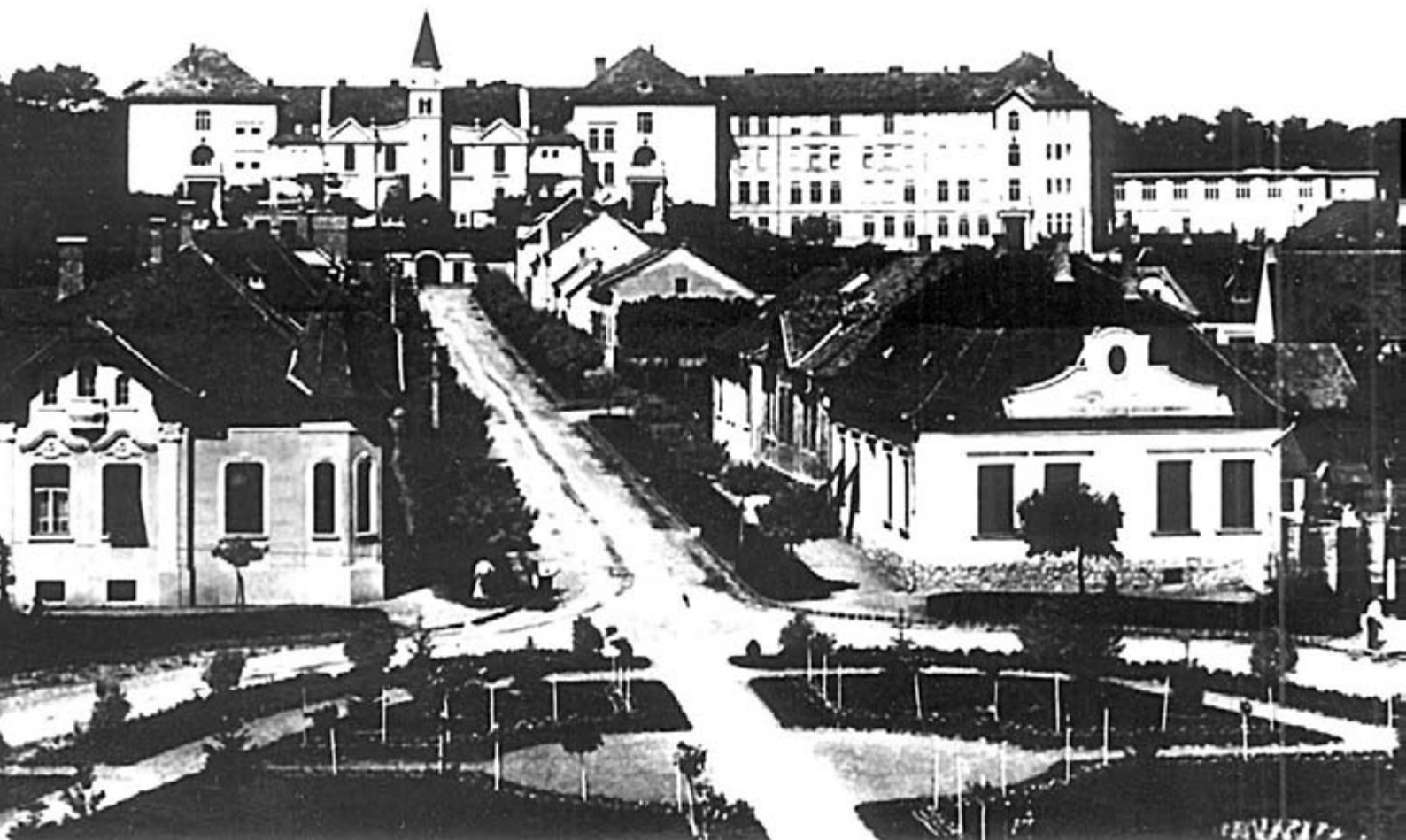
A Zárda épülete (archív fotón)