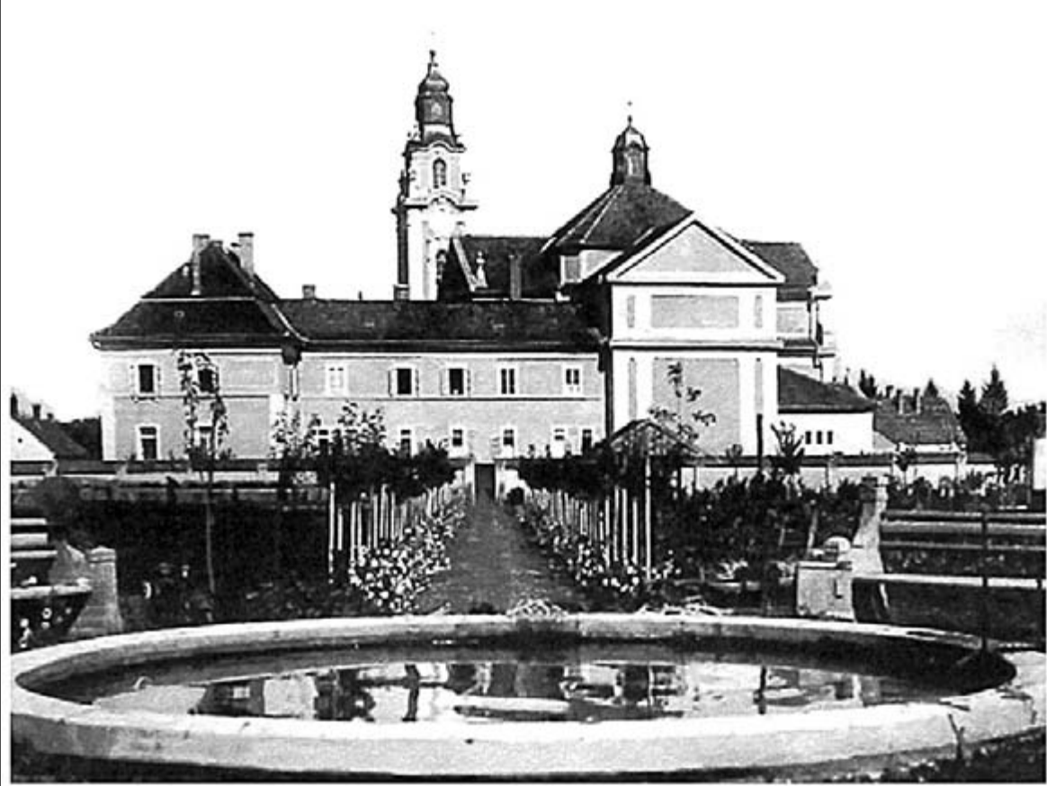
A Ferences Templom hátról (archív fotó)

a második templom építkezését még ez évben megkezdik. Mindszenty beszámolt arról, hogy korábban némi vitája volt az építést illetően az Assisi Szent Ferencz rendű szerzetesekkel, de Budapesten a Rendi Kormány Tanács gyűlésén sikerült megállapodást kötnie. A plébános tájékoztatta híveit, hogy a második templom 2500 hívő befogadására épül, 5 oltárral – Jézus Szentséges Szíve, Szűz Anya, Szent József, Assisi Szent Ferencz és Páduai Szent Antal tiszteletére. A toronyban két harang kap helyet, a kórusban harmónium, a templomban villanyvilágítás lesz. A sekrestye bútorzatát a hitközség adja. A rend csak egy papra szükséges papi és egyházi ruhát igényel. „Ez a kérdés úgy nyer megoldást, hogy a megszüntetendő „Tüttössy” Mária kápolna teljes felszerelését átadják a rendnek. „A zárda 3 páterre és 2 fráterre épül, 8; 15-18 méteres szobával és megfelelő mellékhelyiségekkel, a templommal szoros kapcsolatban. A zárda belső berendezését a hitközség adja. [...] A szerzetesek 1926. október hó 4-én már itt lennének. Kezdetben csak lelkipásztorkodással foglalkoznak, később azután hitoktatást is végeznének.”