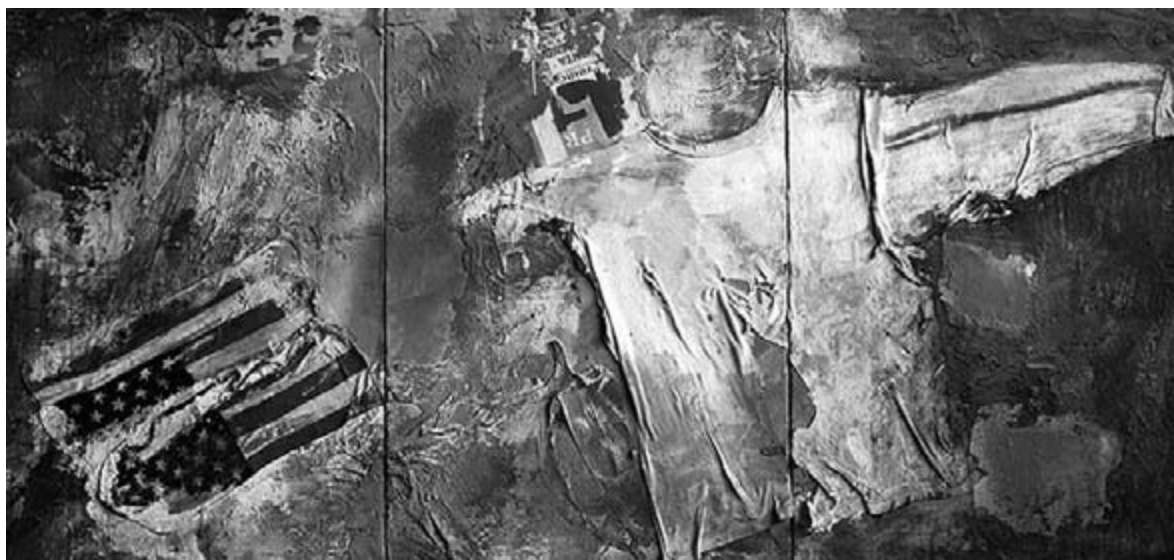
Dús László: Old Glory -vegyes technika -2007

Hogy mit hagyott az USA-ban, arról néhány vaskos album tanúskodik. S művei az Art Institute of Chicago, Detroit Institute of Art, Library of Congress (Washington), Metropolitan Museum of Art (New York), NASA Space Center (Houston), National Gallery of Fine Arts (Washington), The Smithsonian Institute (Washington) tereiben. (Ki tudja, mire elég ez – itthon?) A művész így jellemezte több évtizedes, amerikai korszakát: „Korábbi műveimben, melyet „lírai absztraktnak” nevez néhány művészettörténész, textúrákból, különböző formákból, felületekből, színekből próbáltam harmonikus kompozíciókat létrehozni, elvonatkoztatva mindentől.” Sasvári Edit művészettörténész írja róla a 2002-2003-as, fehérvári-zalaegerszegi mappában: „Egy viszonylag hosszan eltartó lírai absztrakt periódus után kezdett kollázsokat készíteni”. Nos, innen jutott el a „fotófestményekig”. Szintén a művész így vall új módszeréről: „Számomra a fotóknak egymagukban nincs önálló jelentésük. A fotó talált tárgy, kész elem, festői eszköztáram része. A