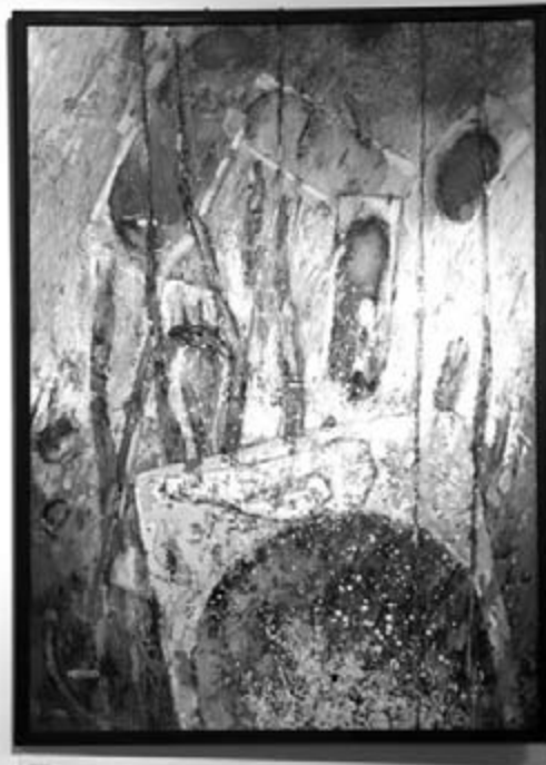
Kotnyek István: Süllyedők

teknővel, ám a fekete-fehér drámaisága után egy vidámabb, oldottabb hangulatot sugárzó, színekavalkádban játszó „belső” képen látjuk viszont. Igen, a látvány, valóban lenyűgöző volt: az egyik oldalon a festett, írásos teknők ívelt, ovális formájú sztéléi, idolljai rendeződtek sokjelentésű csoportozattá, míg a másikon a kisebb és nagyobb fiókok szögletes vázai lényegülnek át festett-díszített plasztikává. S a falon körbefutó képek: rendszerint egy-egy plasztikai motívum festett változatai. Olykor napszítta, eső áztatta, a faanyag erezetét, göcsörtjét, mart-barázdás felszínét (történetét) láttató keretbe téve. Kétségtelen, az első, ami eszünkbe jut – s amire Kostyál László is utalt az 1997-es katalógus előszavában –, a „komplexitás”. Mintha Kotnyek István valamiféle, a tárgyak-jelenségek-történekek körét átható összefüggésekre figyelne, ezeket kutatva, ezeket mutatva fel. Hogyan lesz az élő organizmusból, a használati tárgyból holt anyag, kidobandó tárgy, romlásra ítélt kacat, lom, s viszont: miként élednek újjá (az újraalkotás folyamán) a múlt rekvizitumai, már-már szakrális-kultikus értelemben. Az örök körfogás igézetében. Az áthatások, átlényegülések színjátéka, amit a festő kínál: ábrázolt tárgyai, bár megfoghatóak,