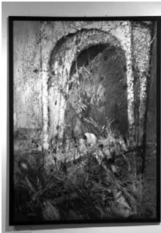
Kotnyek István: Zsarátnok