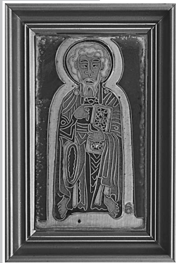
Hidasí Ágnes munkája