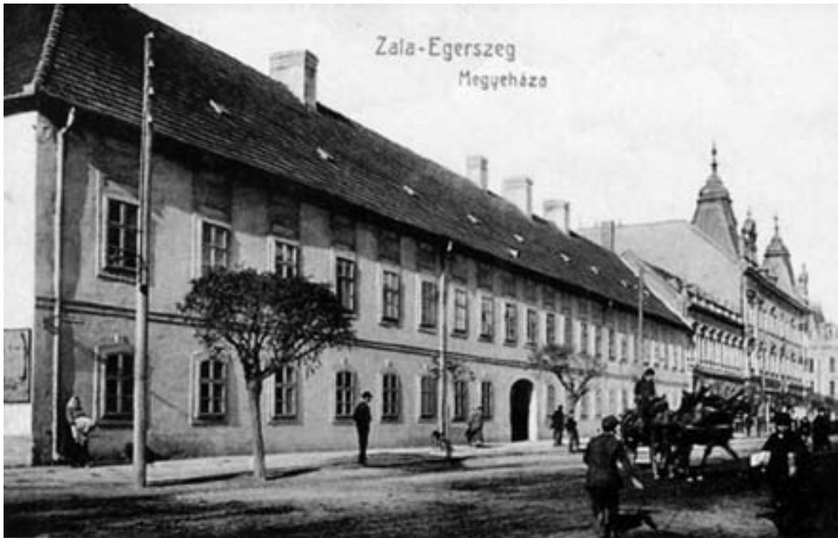
A kvártélyház keleti homlokzata 1914 körül