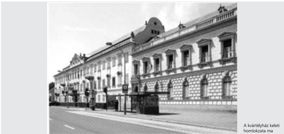
A kvartélyház keleti homlokzata ma

(Zala Megyei Levéltár, Zalaegerszeg, 2009.)