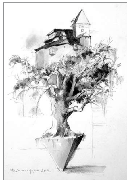
Frimmel Gyula rajza

Egyik talányos kép az Álomkonténer . Főnt romantikus tájrészlet, lent, a föld alatt „elsüllyedt” álmok, gondosan elraktározva. A „dobozolt” álmok azt sugallják: semmi sem vész el. Minden megmarad, megőrződik. Legfeljebb egy másik létszférába, dimenzióba kerülnek át. Túl ezen, Frimmel műveinek van egy sejtelmes, melankolikus hangulata, üzenete: mintha a dűrieri angyal szemlélné a körülötte lévő, múltásba „dobott”, leépülő, romló-bomló világot. Elvágódásokat, nosztalgiákat élnek át figurái, a tárgyas zűrzavarból a spirituális, éteri magasságokbasóvárognak. Talán ezért tudnak rezonálni a bennünk rejtőz kínzó nyugtalansággal, amit akár „istenvágnak” is nevezhetnénk... Ha innen nézzük, akkor ez már nem magányos vállalkozás, hanem a mesterekre jellemző, tudatosan választott, termékeny egyedüllet.