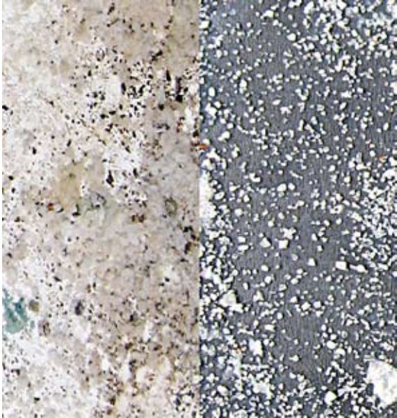
Franko Vecchiet munkája

bír. Képeinek értelmezéséhez a művész alapvetően emocionális beállítottsága képezheti a kulcsot. Lelki történések, belső viharok vagy éppen szélcsendek vizuális lecsapódásaival állunk szemben, amelyek boncolgatása egyrészt az intimitás határát súrolja, másrészt azonban, mint egy tükörben, önmagunkat is felfedezhetjük bennük.