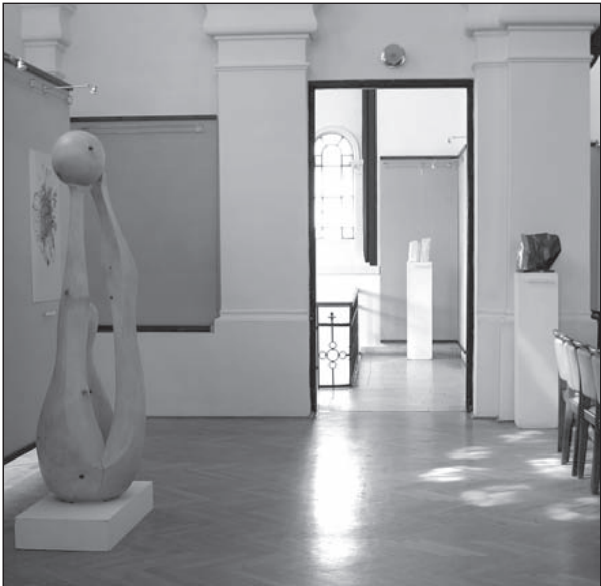
Enteriőr az Európai párbeszéd című kiállításról

A zalai politikatörténet fontos eseménye a könyv megjelenése, amelyből értő művész – például Bereményi Géza – remek filmforgatókönyvet írhatna. Nem kellene sokat pepecselnie vele: a könyv írásos történelmi mozgógép, amelyben hús-vér valójukban, nevükön nevezve és kíméletlenül, néha méltatlanul is jellemezve vonulnak el a kor legismertebb politikusai, gazdasági és katonai szereplői. A szerzője Pacsán megérdemelne hozzá méltó emléket.