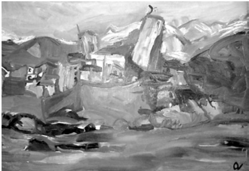
Picasso múzeum Antibes-ben