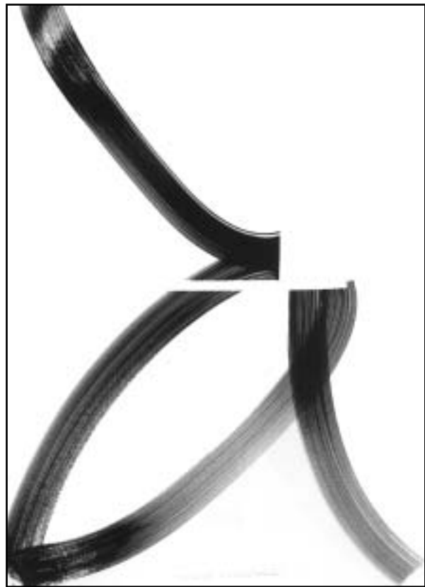
Nádler István: Fb. 2005. III-IV.