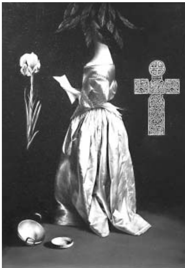
Filep Sándor: Egy kép természetrajza - 1989.