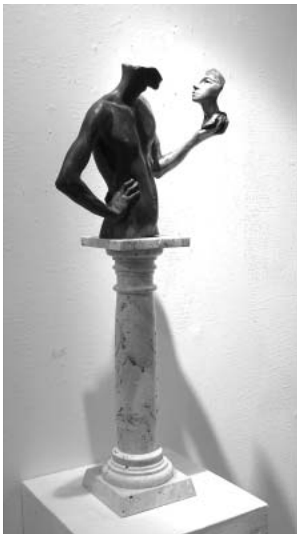
Párkányi Raab Péter: Realista álmok II - 2002.