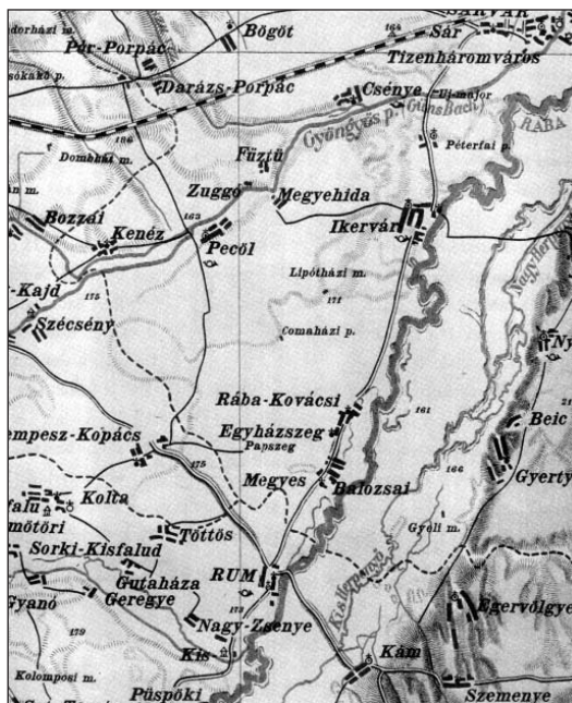
Vasvármegye, részlet az 1884-ben megjelent térképből