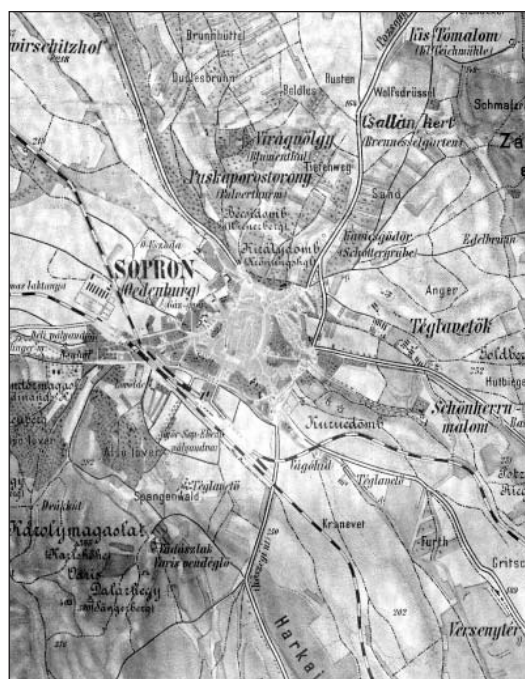
Sopron környéke, az 1884-ben megjelent Sopron megye térképe melléktérképe

A térkép mérete 150x120 cm. A térképi címléírás szabályai szerint az első szám mindig a kelet–nyugati kiterjedést jelenti. Sopron megye mappáját Budapesten, az Eötvös Loránd Tudományegyetemen őrzik (CT-8). A térképet szemlélve elsősorban a színgazdagság nyűgöz le bennünket. Mai térképész szemmel nézve is kitűnő munka ez a könyvatos mű. A fő-térkép hét, a melléktérkép kilenc szín felhasználásával készült. Ezen a mappán minden kézi munka eredménye.