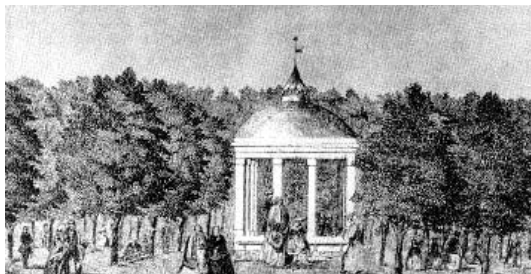
A Savanyúvíz kútháza a Gyógy téren

A fürdővendégek között szép számmal akadtak képviselői az arisztokráciának, az értelmiségnek, a megyei nemességnek, s a korabeli sajtó és fürdőpropaganda elsősorban róluk emlékezett meg. Ugyanakkor nyilvánvaló, hogy a fürdőközönséget nem csupán ők alkották. A korabeli fürdőlisták adatainak alapján 7 az alábbi táblázaton szemléltetjük a balatonfüredi fürdőközönség társadalmi összetételét az 1861. évben, valamint összehasonlítási alapul több más évre vonatkozóan is. 8 Egvértelmű, hogy az 1860-as évek során, s így 1861-ben is a legtöbb fürdővendég a kereskedők közül került