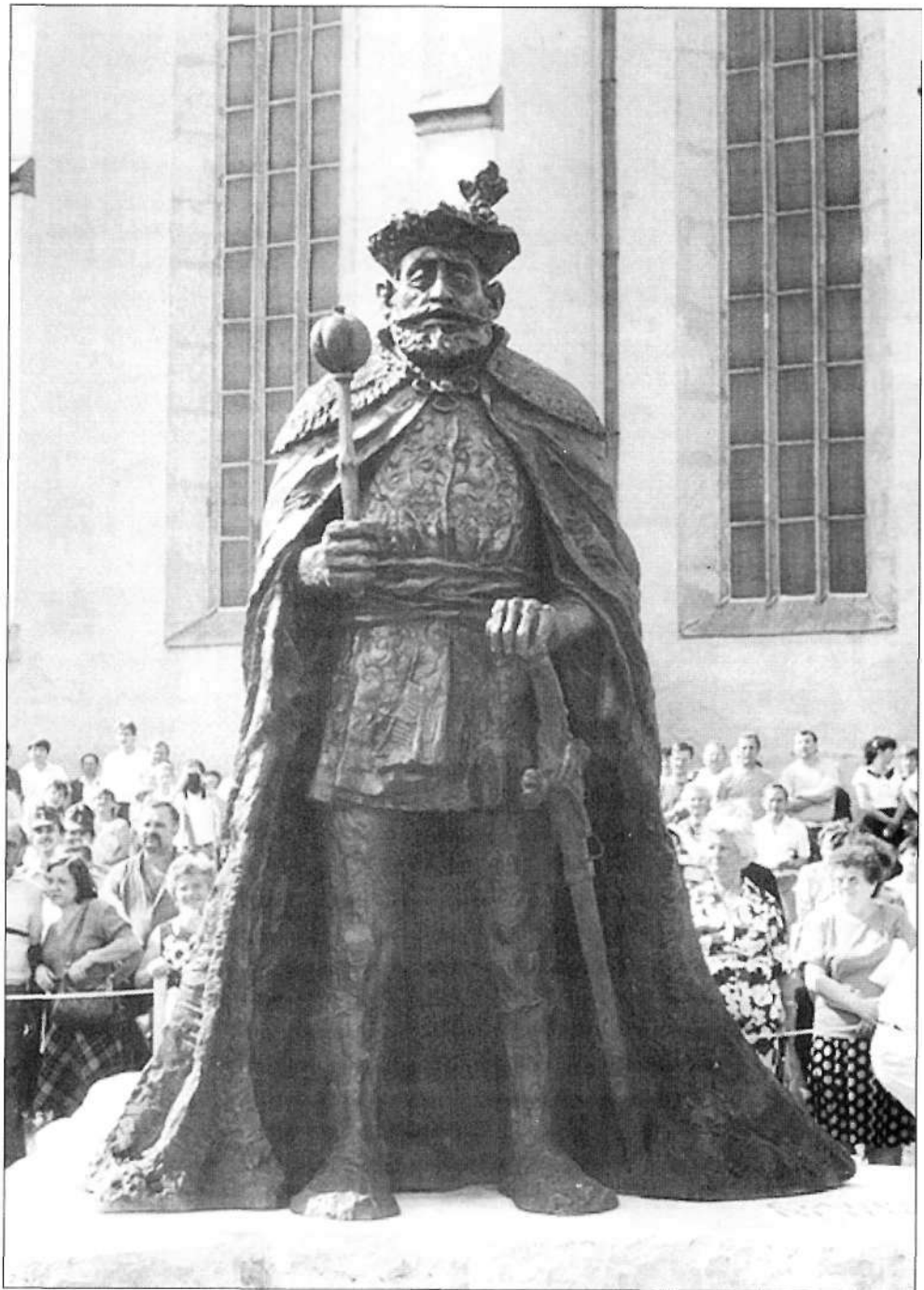
Bethlen Gábor fejedelem, 1 990