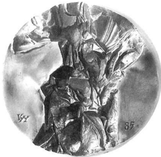
Szakadékok és gerincek I. (1985)