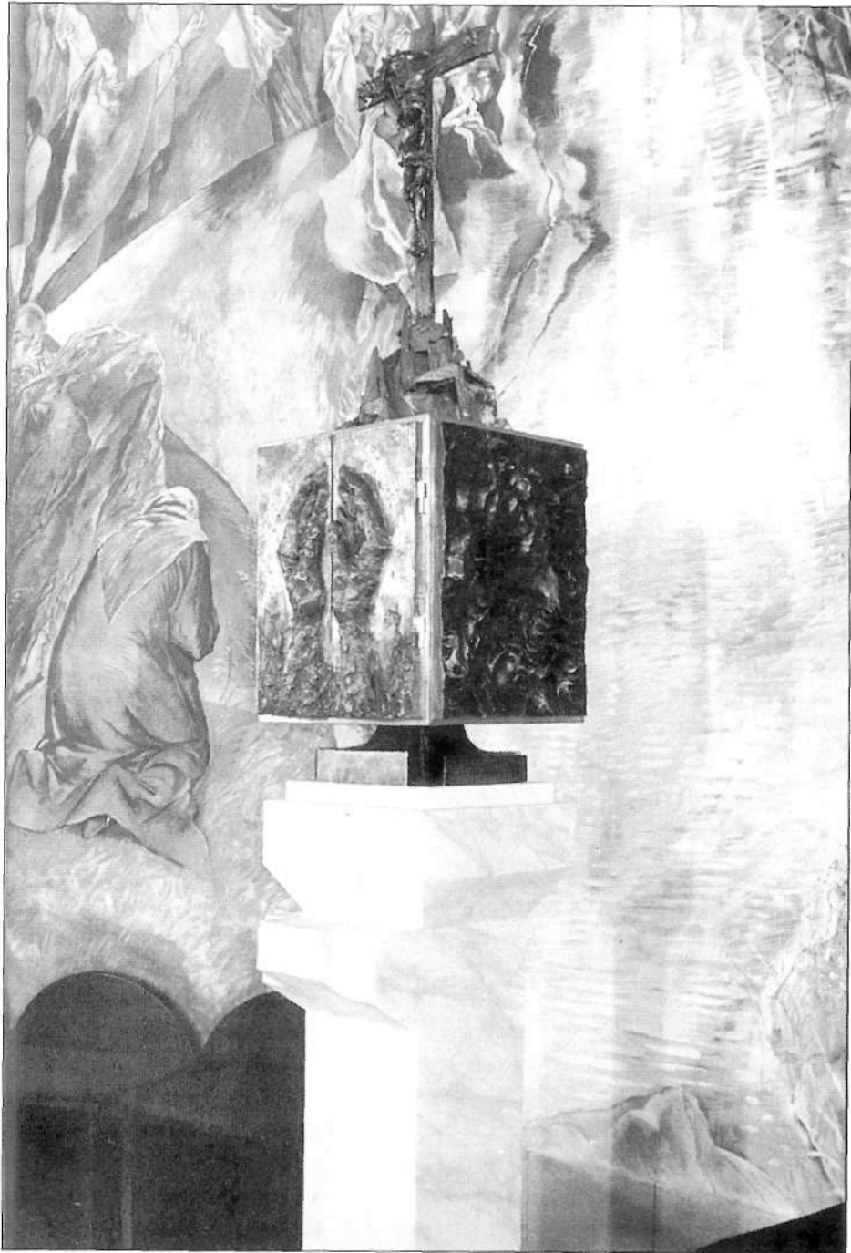
Tabernákulum, korpusszal (1995, Békéscsaba)