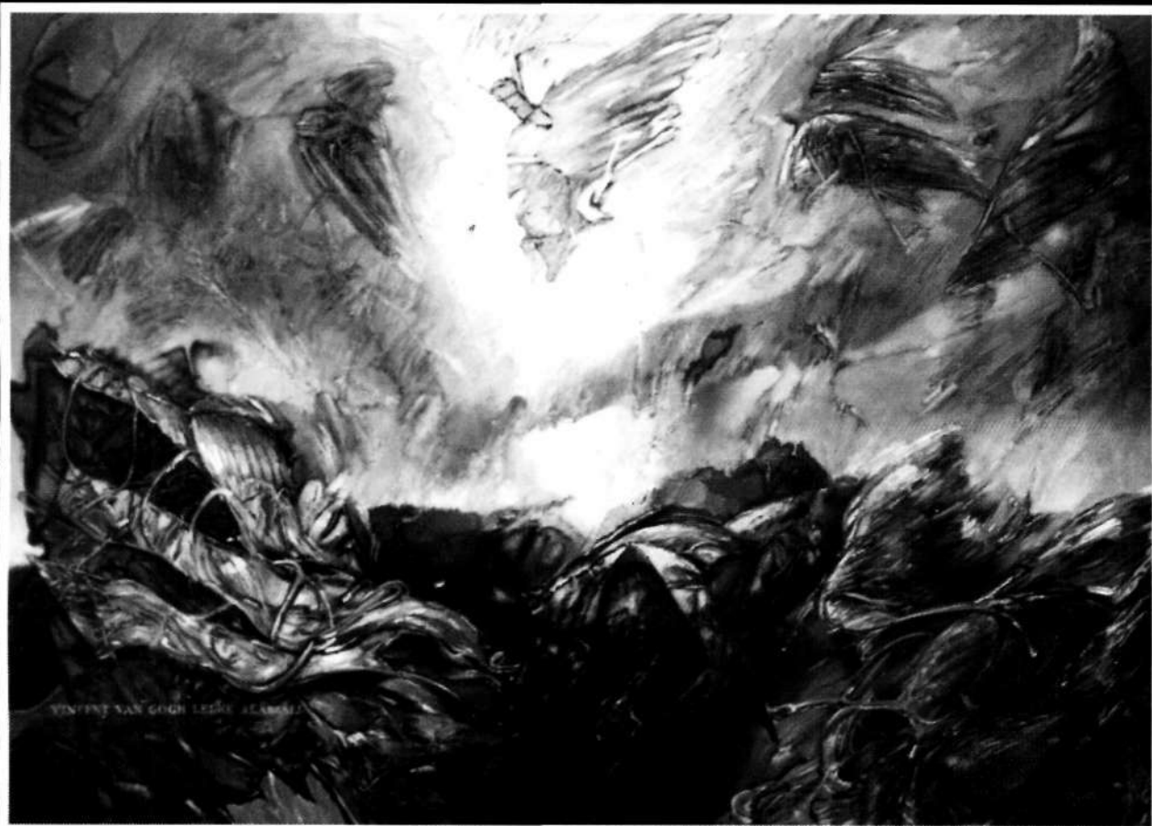
Vincent Van Gogh lelke alászáll, 1992