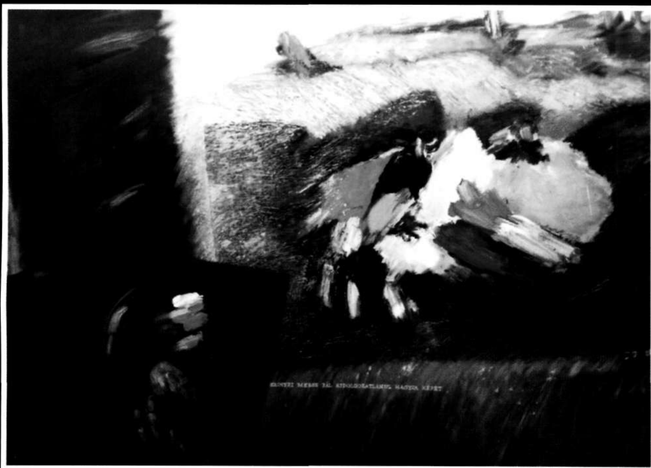
Szinyei Merse Pál kidolgozatlanul hagyja képét, 1997