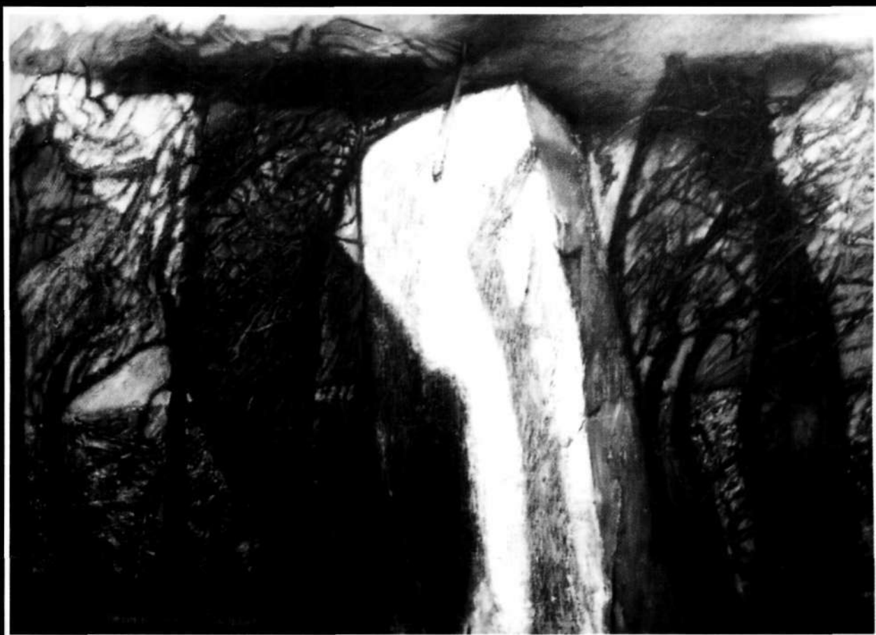
Caspar David Friedrich árnyéka a sziklán, 1996